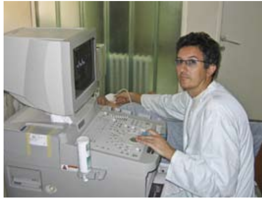
Laboratorij za dopler dijagnostiku