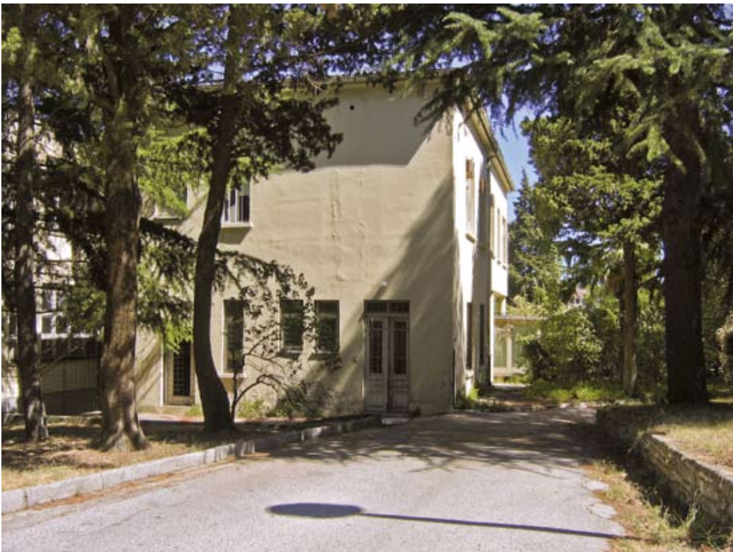
Zgrada u kojoj je radila neurološka djelatnost od 1980.-2001.