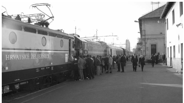
Slika 1. Izložba moderniziranih željezničkih vozila

Svečano otvaranje skupa održano je u četvrtak 21. studenog ujutro u Kongresnoj dvorani hotela »Excelsior«. Prigodnim nastupom otvorenje skupa uljepšala je ženska klapa »Hreljin«. Skup je nastavljen radnim dijelom koji se zbog velikog broja predavanja i brojnih popratnih događanja djelomično održavao i paralelno.