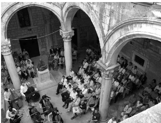
Slika 3. Koncert Dubrovačke filharmonije u Atriju Kneževa dvora za sudionike Konferencije EPE-PEMC 2002

Iz sadržaja i broja prikazanih radova može se zaključiti da je znanstveno i stručno područje elektromotornih pogona i energetske elektronike vrlo aktualno za daljnja istraživanja i primjenu te da se time bavi veliki broj istraživača i stručnjaka iz industrije. To vrijedi globalno jer su na konferenciji aktivno sudjelovali ljudi sa svih kontinenata.