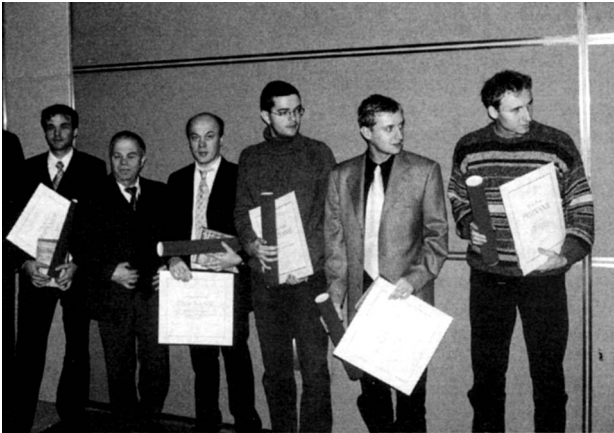
Sl. 1. Dobitnici nagrada »Prof. dr. V. Bedjaniča«