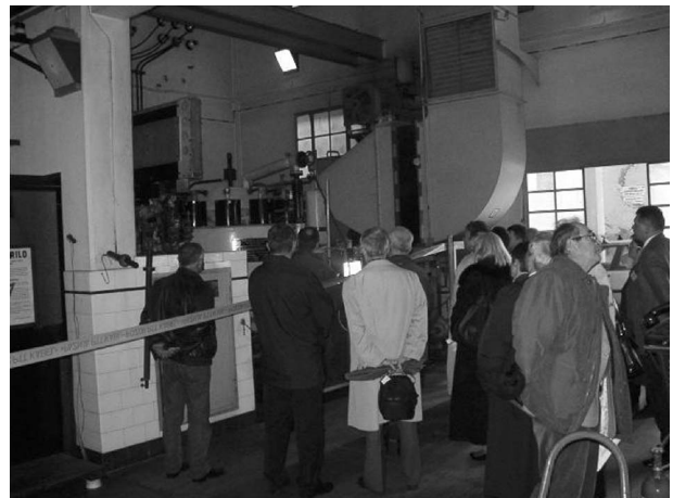
Slika 3. Razgledavanje živinog ispravljača u EVP Matulji

i korištenju stanja željezničke tehnike, aktivnostima tehničkog odbora DZNM/ETO 9 na normizacijskom uređenju primjene elektrotehnike na željeznici, smjernicama razvoja željeznica u tranzicijskim zemljama, novoj informacijsko-komunikacijskoj infrastrukturi Hrvatskih željeznica, perspektivnosti istosmjernih sustava za napajanje električne vuče s naponima 6 i 12 kV, testiranju i mjernim metodama za optimiranje energije za vuču i smanjenje troškova vršne snage za razne tipove vlakova te pouzdanim »fail-safe« automatiziranim sustavima upravljanja željezničkim prometom primjenom sofisticiranih signalnih i informatičkih rješenja. U trećem su dijelu održana dva komercijalna predavanja i to tvrtke Siemens o željezničkim vozilima (u sklopu kojeg je organizirano predavanje i vožnja elektromotornim vlakom Desiro ) i tvrtke Alcatel o automatizaciji upravljanja željezničkim prometom. U okviru željezničke sekcije u subotu 23. studenog organizirana je i stručna ekskurzija u elektrovoćnu podstanicu Matulji (gdje su sudionici skupa mogli vidjeti vjerojatno još jedini živin vakuumski ispravljač koji je i danas u funkciji u Europi) te kolodvor Matulji u čijoj su carskoj čekaonici djelatnici Hrvatskih željeznica prikazali povijesnu ulogu željeznice kao pokretača razvoja turizma na opatijskoj rivijeri.