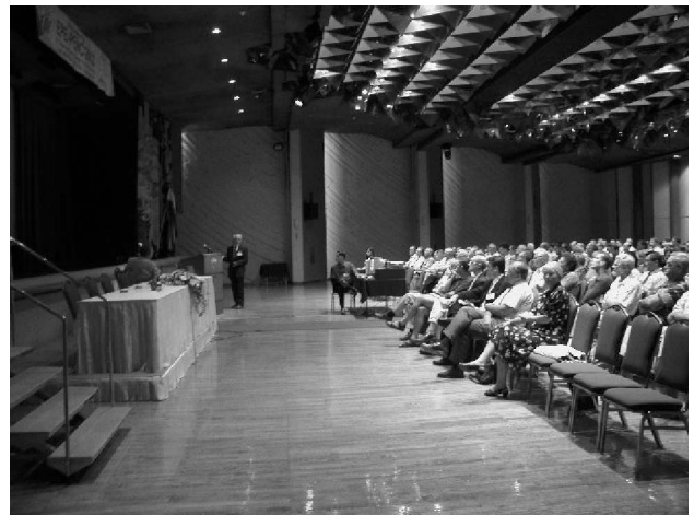
Slika 1. Radni dio skupa u dvorani Raguza, hotel Croatia

Sekcije s najvećim brojem radova bile su Motion Control (52), Electrical Machines and Actuators (48) te Power Converters (43).