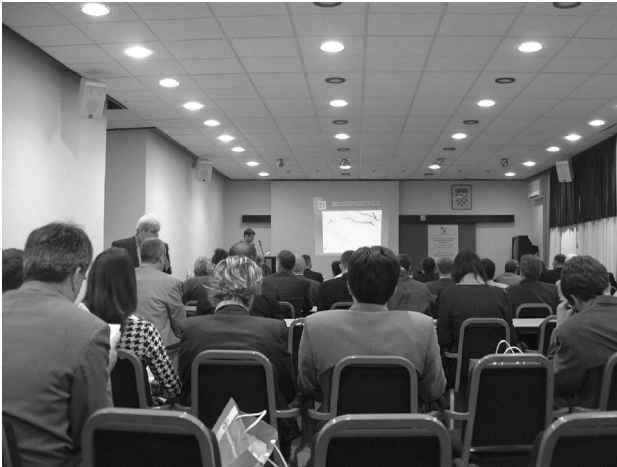
Slika 2. S radnog dijela skupa

ba. U okviru ove sekcije drugog je radnog dana održan i već tradicionalni okrugli stol Mobilnost osoba s invaliditetom kojem je bio nazočan velik broj invalidnih osoba iz cijele Hrvatske te nekolicina i iz inozemstva. Kao sastavni dio ove sekcije drugog i trećeg dana organizirane su dvije stručne ekskurzije i to u Centar za upravljanje cestovnim prometom grada Rijeka i Centar za upravljanje tunelom Učka.