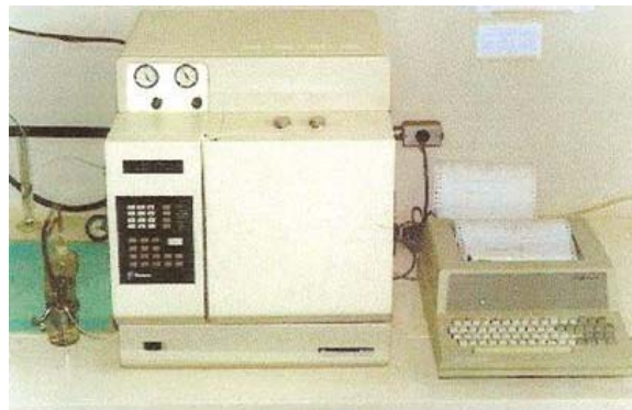
Figura 4. Cromatógrafo gasoso utilizado na análise das amostras.

100% poliamida, com poros de 50 micrometros, com área disponível correspondendo a 14,0 x 7,0 cm, contendo aproximadamente 5 gramas, onde cada saquinho foi incubado no rúmen durante um período de 12 horas