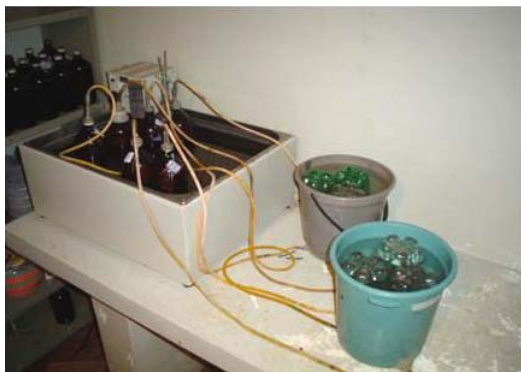
Figura 2. Garrafas de vidro âmbar contendo líquido ruminal e substrato colocadas em banho maria adaptadas a baldes plásticos contendo recipientes confeccionados para aprisionamento dos gases produzidos durante a fermentação