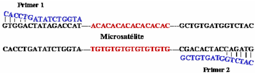
Figura 2. Microsatélites, ejemplo de un di-nucleótido A-C(n).

de oligonucleótidos (iniciadores) cortos, los cuáles a través de una reacción PCR, que se caracteriza por temperaturas de «annealing» bajas, lo cual genera una serie de fragmentos de amplio espectro a partir del ADN molde. La habilidad consiste entonces en encontrar aquellos fragmentos amplificados y que resulten ser polimórficos, los cuáles pueden posteriormente ser mapeados. Una de las principales limitaciones del uso de los RAPDs es la baja repetibilidad de los análisis, aunado a la necesidad de usar un gran panel de RAPDs, lo que representa un elevado valor económico y un laborioso trabajo analítico. Asimismo, y dado que es un marcador genético de tipo dominante, no podemos discriminar la existencia de heterocigotos, subestimando la cantidad de polimorfismo existente (Levin et al. , 1994).