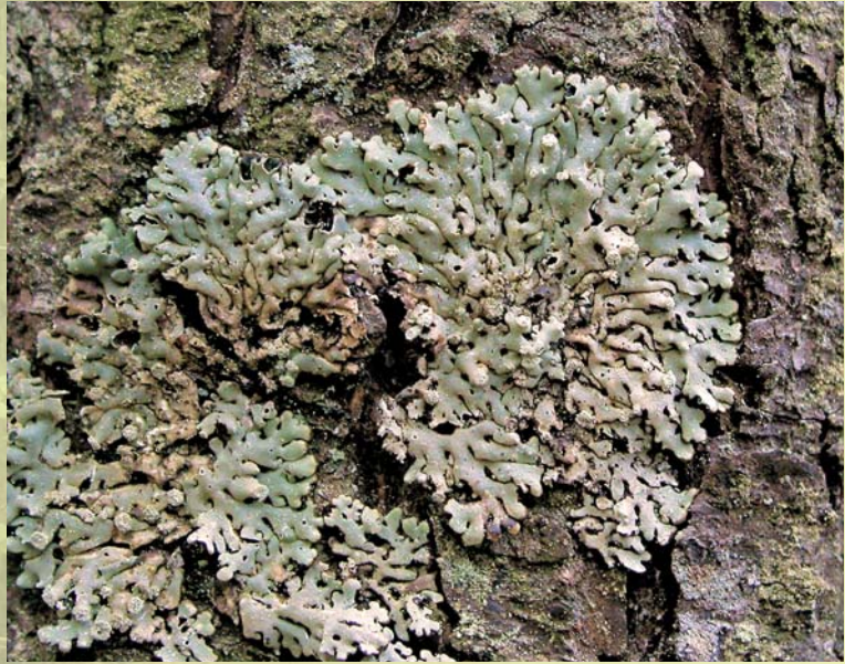
Harilik poorsamblik kasvab vanades ja kuivendamata lodumetsades.

Ehkki liik on Eestis veel üsna sage, on selle asurkonnad väikesed, kasvukohad üksteisest eraldatud ning kopsusamblikku ohustab pidev sobivate elupaikade kadumine. Vanade ja kuivendamata lodumetsade indikaatorliigiks peetakse aga harilikku poorsamblikku. Ta kasvab peamiselt sanglepal ja kaskedel ning on Eestis märgatavalt haruldasem kui kopsusamblik. Poorsamblik on väljanägemiselt sarnane meil väga tavalise hariliku hallsamblikuga. Kahe liigi hea eristustunnus on väikesed augukesed poorsambliku talluse pinnal – sellest tulenebki tema nimi.