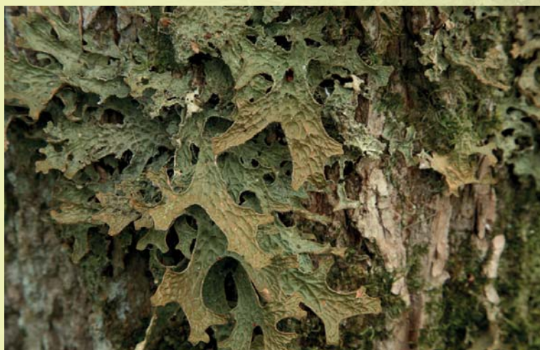
Harilikku kopsusamblikku kasutatakse põlismetsade ja vääriselupaikade indikaatorliigina.

Samblikel on metsaökosüsteemides mitu olulist rolli, näiteks on nad elupaigaks putukatele ja teistele selgrootutele ning linnud kasutavad neid sageli pesamaterjalina. Eri samblikud vajavad kasvamiseks erinevaid niiskus- ja valgustingimusi, mistõttu sõltub nende liigiline koosseis peamiselt metsatüübist ja domineerivast puuliigist. Teisalt võib mõne liigi esinamiseks olulisem olla hoopis mikroelupaiga olemasolu, näiteks elusa puu korbapragu, tüügaspuu ja kännu kõdunenud puit või hoopis mahakukkunud puuoks. Osa samblikke vajab aga kasvupinnaks koguni söestunud koort ja puitu, näiteks männi-soomussamblik, kes asustab meil vanu metsapõlengualasid. Üldiselt on samblikufloora rikas ja eriilmeline just mitmesugustes looduslähedastes metsades. Näiteks lodumetsades, kus on sobiv niiske mikrokliima ja mitmekesine kasvustraatide valik eri nõudlusega liikidele. Haruldasi samblikke esineb ka laialehistes salumetsades, kus puutüvede alumises osas kasvavad varjutaluvad (sageli koorikja tallusega), ent ülaosas valguslembesed (peamiselt lehtja tallusega) liigid. Põnevaid liike võib leida haavikutestki – mitmed tsüanobakteriga samblikud kasvavad just vanade haabade korbal, näiteks mustja tallusega haava-tardsamblik.