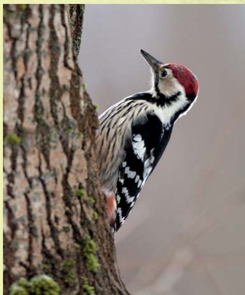
Valgeselg-kirjurähn rind on triibuline ja selg kirju.