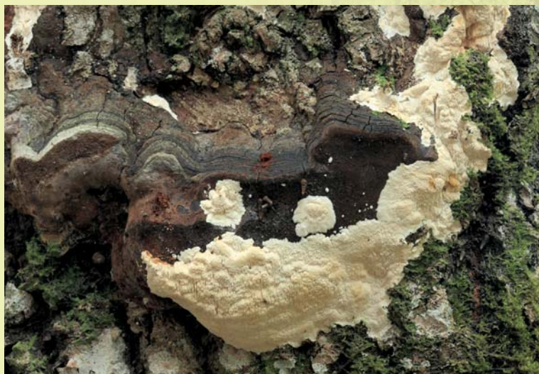
Haavanäätsu kreemika värvusega liibuvaid viljakehi võib leida vanadelt haavataeliku viljakehadelt.

Eestist on leitud tuhandeid seeneliike, suur osa neist on seotud metsaga. Kõige arvukam metsaga seotud seenerühm on puidul elavad torikseened. Ehkki torikseened lagundavad puitu ja põhjustavad seeläbi majanduslikku kahju, on neil ökoloogilises ainerings oluline roll. Teine suur rühm torikseente kõrval on lehikseened, kellest palju liike elavad metsapuu-dega sümbioosis ehk vastastikku kasulikes suhetes. Lehikseente hulka kuulub ka rohkesti tuntud söögiseeni, näiteks riisikad, pilvikud ja kukeseened. Lisaks meil küllalt tavalistele seeneliikidele leidub mõlemas rühmas ka haruldusi, neist osa on võetud looduskaitse alla või kantud Eesti ohustatud liikide punasesse nimestikku. Looduskaitsealuseid seeni on meil 46 liiki, millest enamik elab metsades.