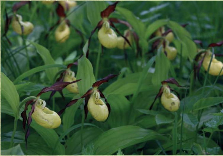
Kaunis kuldking kasvab sageli kinnikasvanud puisrobumaadel

Soostunud ja soometsades kasvab haruldasi eri liiki tarnu ja kõrrelisi, kuid nende määramine on tihtipeale keeruline. Väärtuslikust soometsast annavad teinekord märku ka erinevad orhideeliigid: kuradi- ja vööthuul-sõrmkäpp, kõdu-koralljuur, väike käopõll. Allikalistele aladele viitavad allakäändunud latvadega jässakad kuused, Lõuna-Eestis ka osjadega sanglepikud ja kaasikud, kus mätaste vahel läigib roosterikast, justkui õlist vett. Sellistelt aladelt puude maharaiumist peaks kindlasti vältima, sest seal leidub erinevatest elustikurühmadest haruldusi.