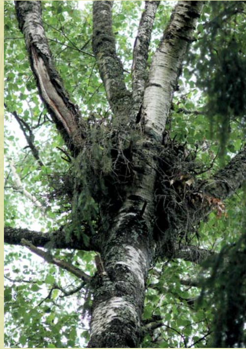
Risupesa – võimalik haruldase linnuliigi elupaik.