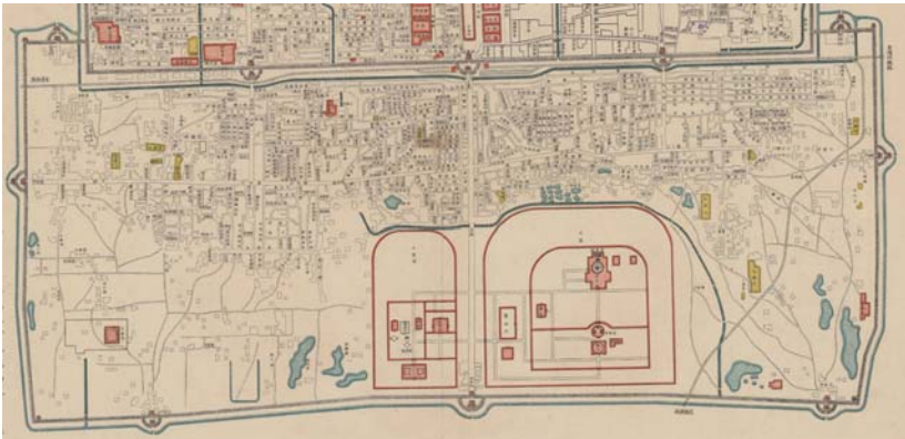
図3 會館が集中している区域