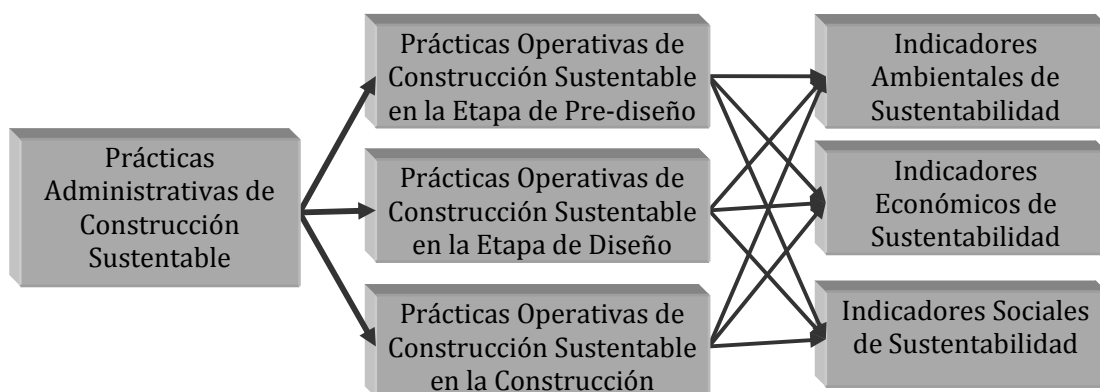
Figura 1. Modelo conceptual del sistema propuesto

De acuerdo a lo anterior, la Figura 1 muestra el modelo conceptual bajo el cual se construirá el sistema propuesto en este trabajo de investigación.