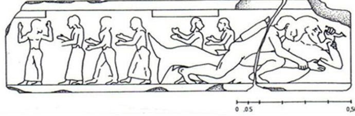
Resim 2 Herakles'in Deniz Canavarı ile Mücadelesi, Troialılar ve Hesione 6

Sol kolunu dirsekten yukarı kaldırmış ve sol elinde ne olduğu anlaşılamamış bir nesne tutan Deniz Canavarı'nın belinin altından başlayan ve gövdeye geçişi kendi sağ koluyla gizlenmiş olan kuyruğunun ucu çatallıdır. Sartiaux'nun Deniz Canavarı'nın elinde "deniz kabuğu" olabileceğini söylemesine karşın nesnenin ucu, belirttiği gibi ağza değil alın hizasına gelmektedir. Deniz ile ilişkili bazı yaratıklarda rastlandığı üzere, bir balık (bazen yunus) tutulabilir. Herakles'in kalçasının ve sağ topuğunun arkasından görülen ve kuyruğa dâhil çıkıntılar, yüzgeç olmalıdır. Orvieto Claudio Faina Müzesindeki Deniz Canavarı'nın gövdesinde, kuyruk uçları haricinde üç yüzgeci bulunmaktadır 7 . Uzun giysili olan arka plandaki figürler ( Resim 3 ) sola doğru hareket halindedir. Öndeki figür, gövdesi cepheden, elleri iki yanda havada, bacakları soldan görünüşlü, başı geriye dönük olarak betimlenmiştir. Arkasında bulunan diğer beş figürün tümü, sol profilden ve iki kolunu dirseklerden farklı açıyla kıvrarak, bitişik parmaklı ellerini öne uzatmış durumda gösterilmiştir. Bu figürlerden üçüncü ve beşinci arkaya doğru bakmaktadır.