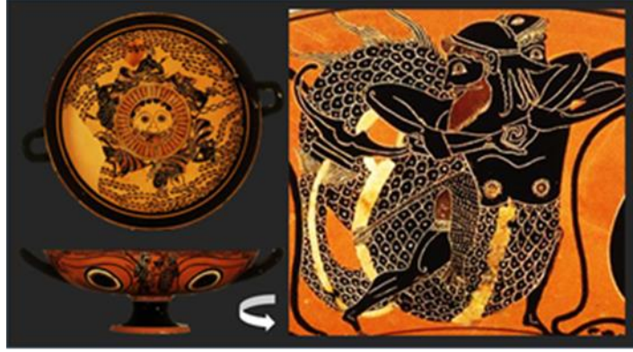
Resim 5 Paul Getty Müze Malibu.87.AE.22 Envanter Numaralı Kylix 34

Tarquinia'dan yaklaşık M.Ö. 550'ye tarihlenebilecek bir kylixin 35 tondosunda Herakles Deniz Canavarı mücadelesi varken etrafında el ele tutuşarak aynı yöne koşan on yedi kadın betimlenmiştir ( Resim 6 ). Bu betim Herakles Nereus mitosuyla yorumlanarak Nereus'a dans ederek destek veren Nereidler olarak yorumlanmıştır 36 . Hesione ve Herakles mitosunun betimlendiği tartışmasız olan ve genelde diğer araştırmacılar tarafından da bu şekilde kabul edilen 37 M.Ö. 550'ye tarihlenen siyah figür tekniğindeki Boston Kraterindeki 38 ( Resim 7 ) sahnede Herakles'in saldırdığı yaratık, yarı insan yarı balık bir Deniz Canavarı olmayıp, sadece korkunç görümlü bir baş biçimindedir. Mitolojide Deniz Canavarı olarak geçen ve antik kaynaklarda ayrıntılı anlatılmayan Deniz Canavarı, mitosu yorumlayan sanatçılar tarafından bazen insan ve balık unsurlarından karışık bir yaratık, bazen bir baş bazen de iri bir balık 39 olarak betimlenmiştir.