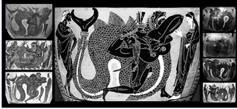
Resim 8 Boston Güzel Sanatlar Müzesi 62.1185 Numaralı Hydria ve Benzerleri 44