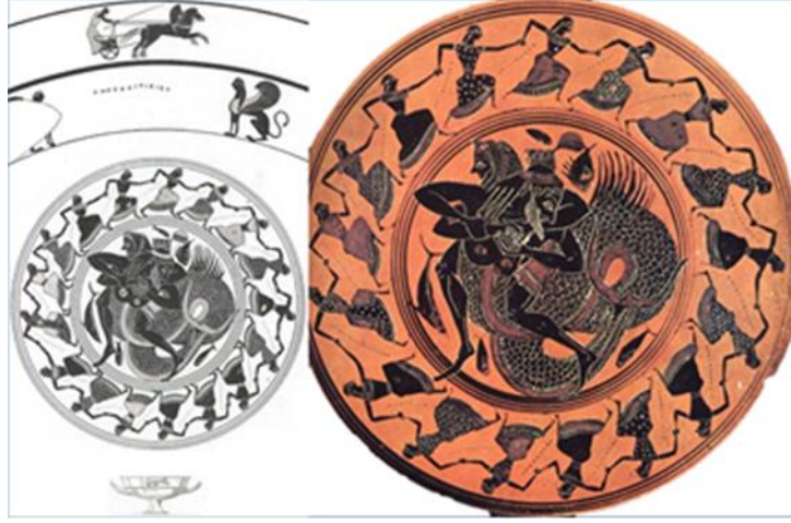
Resim 6 Tarquinia Milli Müze Tarquinia.RC4194 Envanter Numaralı Kylix 40

Siyah figürlü ve M.Ö. 530'a tarihlenen bir hydriada 41 , ortadaki sahne "Herakles-Triton Mücadelesi", yanlardaki figürler ise yaşlı bir erkek (Nereus), Poseidon ve muhtemelen Nereidler olarak adlandırılmıştır. Bu sahnenin altındaki frizde ise koşan atlılar yer almaktadır. Bence, sahnenin merkezindeki mücadelenin Herakles ile Deniz Canavarı , yaşlı erkek figürünün Laomedon , arkasındakinin kızı Hesione , diğerlerinin ise, Poseidon ve bir Nereid olarak yorumlanması daha olasıdır. Üstelik altta yer alan atlılar frizi, böylelikle Laomedon'un ölümsüz atlarıyla bağdaşabilir. Yani, vazo resminin üst ve alt sahnelerindeki konu bütünlük kazanarak, Assos Athena Tapınağı'nın Herakles'in Deniz Canavarı ile Mücadelesi frizi ve aynı cephede yer alması muhtemel tapınak metopları arasında bulunan atlı figürü ile karşılaştırılabilir. Clarke, Assos Athena Tapınağı'nın ön cephesinin yeniden tasarımını yaparken, Herakles ve Deniz Canavarı frizinin yanına, hiçbir parçası ele geçmemiş bir başka blok yerleştirmiş, bu friz bloğu üzerinde Laomedon'un ölümsüz atlarını ve Hesione'yi betimlemiştir.