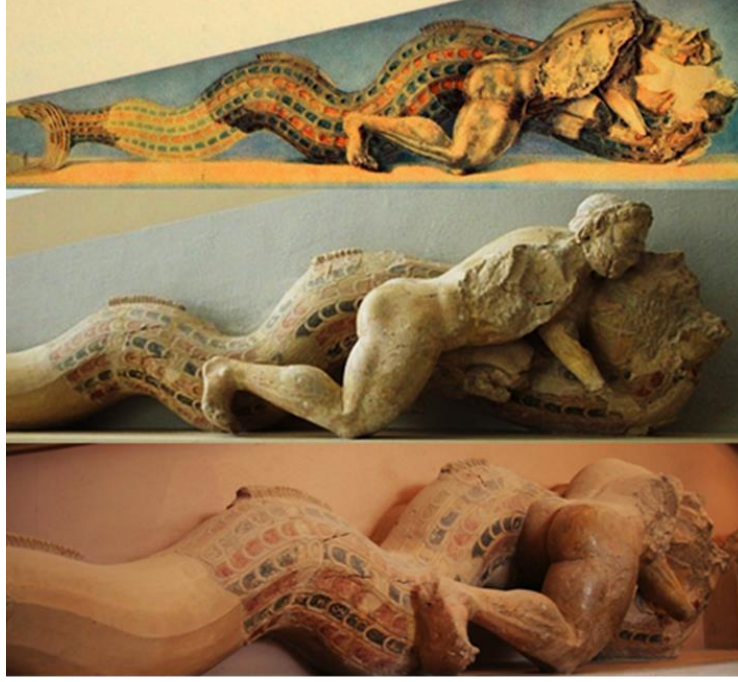
Resim 4 Akropolis Müzesi Atina.Akr.36 Envanter Numaralı Alınlık 27

Herakles ise bu figürün vücudunun ön planına yerleştirilmiştir. Ayrıca Herakles'in sol bacağı her ikisinde de adeta sıkıştırılmış gibi görünmektedir. Örneklerde Herakles, canavarın yanında olmaktan çok, önündedir. Bu durum alınlık merkezinden köşelere doğru daralma için uygun gelmektedir. Üçgen veya dörtgen alandaki Herakles'in durumu değişmemektedir. Alınlık kompozisyonlarında Herakles sadaksızdır. Akropolis 2 alınlığındaki Triton, kol pozisyonu açısından Assos frizine benzemektedir. Alınlıktaki figür elinde bir balık tutmaktadır. Gerek Akropolis 2 alınlığında, gerekse vazo betimlerinde, Assos frizlerindeki gibi yüzler yandan görünmektedir. Alınlık eserleri, Assos frizlerine vazo betimlerinden daha çok benzer. Kas ve saç yapıları göz önünde bulundurulursa Assos frizleri, Akropolis 36 ve Akropolis 2 alınlıklarından daha geç bir tarihe ait olmalıdır. Assos mimari kabartmalarına daha yakın tarihli, muhtemelen Sicilya (Gela?) kökenli ve M.Ö. 6. yüzyılın üçüncü çeyreğine ait benzer konulu bir sunak