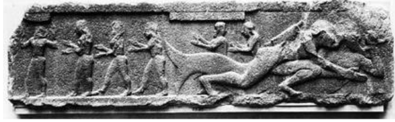
Resim 1 Herakles'in Deniz Canavarı ile Mücadelesi, Troialılar ve Hesione 2

Assos Athena Tapınağı'nın heykeltıraşlık eserlerinde nadiren yeni çıkan ve birleşenler 3 olsa da çoğu yüz elli yıldır görülmekte ve incelenmekte olanlar henüz tam yorumlanabilmiş değildir. Konumuz olan Louvre MA 2828 numarayla kayıtlı friz bloğu 4 ( Resim 1 ve 2 ), 1838'de bulunmuştur. Birleşebilen iki parçadan oluşan friz bloğunun, köşe kırıkları haricinde kompozisyon tümüdür. Rölyefte, Herakles'in yüzünün bir kısmı eksiktir. Kabartmanın diğer ayrıntılarında, hava koşulları gibi dış etkenlerden kaynaklanan aşınma görülmektedir. Assos Athena Tapınağı friz bloklarında, perspektifsiz, simetrik ve tek planlı sahneler yer alırken, burada, ön planda Herakles ve Deniz Canavarı, arka planda ise daha küçük betimlenmiş altı figür görülmektedir. Çıplak ama sadakla betimlenmiş Herakles, öne uzattığı sol bacağı dizden geriye bükmüş, sağ bacağı tümüyle geriye doğru uzatıp Deniz Canavarı'na hamle yapmış ve onun gövdesini arkadan kavrayarak ellerini bileklerinden yakalamıştır. Herakles figürünün sivri sakalı ve ensede toplu saçları görülebilmektedir. Sartiaux Herakles'in sakalsız olduğunu söylese de Finster-Hotz dönem içerisinde hep sakallı tasvir edilen Herakles'in burada sakalsız betimlenmiş olduğunun düşünülmesinin yüz bölümündeki eksiklikten kaynaklandığını vurgulamıştır 5 .