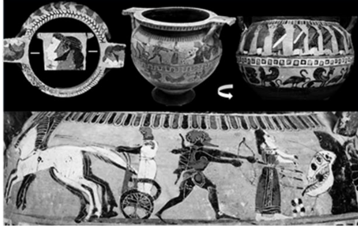
Resim 7 Boston Güzel Sanatlar Müzesi Boston.63.420 Envanter Numaralı Krater 42

Bir diğer Boston Hydriasında da 43 ( Resim 8 ) görüleceği gibi ortada Herakles ve Deniz Canavarı'ndan oluşan ana sahnenin iki yanında yaşlı erkek ve sayıları değişen kadın figürleri M.Ö. 530-520 tarihleri için kalıp denebilecek kadar alışılmış bir kompozisyon oluşturmuştur.