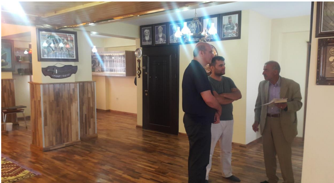
Cem yapılan mekanda tanıtıcı bir hasbihal.