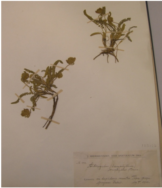
Astragalus densifolius Lam. subsp. densifolius . / gümüş geven