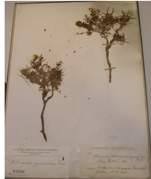
Astragalus gymnolobus Fisch./ cibil giveni