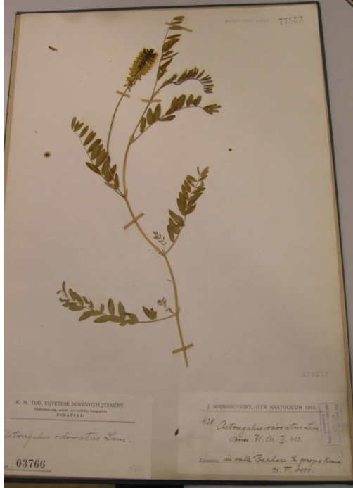
Astragalus odoratus Lam. / misk geveni