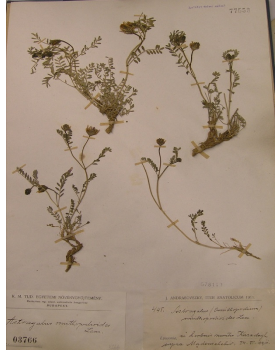
Astragalus ornithopodioides Lam. / pala geveni