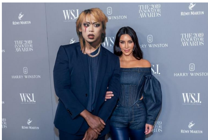
Fanin muokkaama kuva "Kyosta ja hänen tyttöystävästään" keskustelussa Kyo's girlfriend? 2020.

Yksi kommentoijista ei tajunnut vitsiä, vaan syytti edellistä kommentoijaa trolloamisesta ja huomautti, että nainen kuvassa on Kim Kardashian. Hän liitti kommenttiinsa kuvan alkuperäisen version. Eräs fani kysyi alkuperäisen kuvan lataajalta vitsikkäästi, miksi hän oli muokannut Kanye Westin kasvot Kyon tilalle. 330 Keskustelusta voidaan