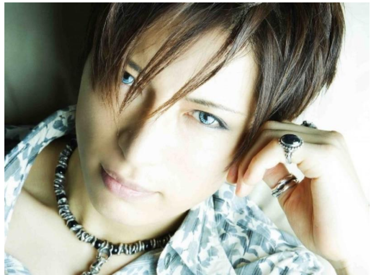
Malice Mizer. & Gackt.

Gackt on visuaalisen rockin idoli-ikoni. Hän on yksi kansainvälisesti tunnetuimmista japanilaisista pop-rock-artisteista. 18 Uransa Gackt aloitti vuonna 1993. Vuonna 1995 hän liittyi yhtyeeseen Malice Mizer, joka tunnetaan yhtenä merkittävimmistä visual kei pioneereista. 19 Vuodesta 1999 lähtien Gackt on toiminut sooloartistina. Tunnettavuudestaan huolimatta Gackt ei ole konsertoinut länsimaissa yhtä runsaasti kuin DIR EN GREY ja the GazettE. Musiikkiuran lisäksi Gackt on vaikuttanut elokuva-alalla.