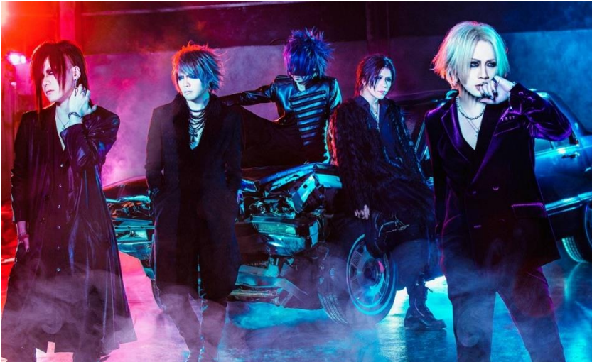
the GazettE.

the GazettE on vuonna 2002 perustettu bändi, jonka jäseniä ovat: laulaja Ruki, kitaristit Aoi ja Uruha, basisti Reita sekä rumpali Kai. the GazettE on yksi visual kei tunnetuimmista nimistä sekä Japanissa että ulkomailla. Musiikkityyliltään he edustavat raskasta rockia, mutta kokeilevat yhdistellä musiikkiinsa erilaisia elementtejä esimerkiksi punkista ja hip hopista. 16 DIR EN GREYn ohella the GazettE on konsertoinut länsimaissa lukuisia kertoja, sekä myynyt konserttihalleja loppuun.