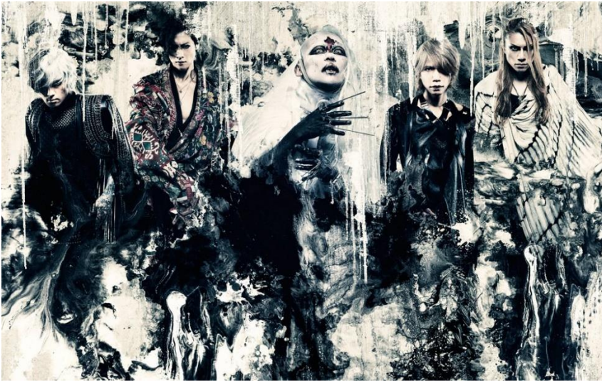
DIR EN GREY. Kuva: sun-krad Co., 2019.

Jokainen yhtye on tehnyt musiikkia yli 15 vuotta ja on edelleen aktiivinen. Bändien kokoonpano on pysynyt vuosien ajan samana, joten fanikanta on vakiintunut.