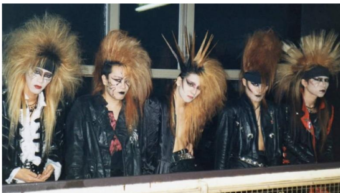
X Japan on tunnetuin visual keitä edustava yhtye. Yhtye on perustettu vuonna 1982 ja on aktiivinen tänäkin päivänä.