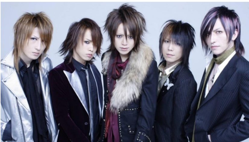
Alice Nine.

the GazettE on vuonna 2002 perustettu bändi, jonka jäseniä ovat: laulaja Ruki, kitaristit Aoi ja Uruha, basisti Reita sekä rumpali Kai. the GazettE on yksi visual kei tunnetuimmista nimistä sekä Japanissa että ulkomailla. Musiikkityyliltään he edustavat raskasta rockia, mutta kokeilevat yhdistellä musiikkiinsa erilaisia elementtejä esimerkiksi punkista ja hip hopista. 16 DIR EN GREYn ohella the GazettE on konsertoinut länsimaissa lukuisia kertoja, sekä myynyt konserttihalleja loppuun.