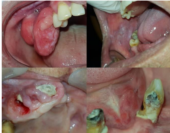
Figura 1. Arriba Izquierda: Lesión de hiperplasia gingival fibrosa derivada por odontólogo generalista. Arriba Derecha: lesión leucoplasiforme derivada por médico geriatra. Abajo Izquierda: Osteonecrosis Maxilar asociada al consumo de fármacos antirresortivos, paciente derivado por médico oncólogo. Abajo Derecha: lesión ulcerada de piso de boca compatible con úlcera traumática crónica que concurrió a la consulta estomatológica derivada por su odontóloga de cabecera con tratamientos previos no exitosos.