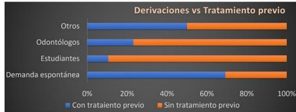
Figura 3. Subtipo de derivaciones según tratamiento previo

El 44% de la patología registrada fue de DPM/cáncer bucal. Entre ellos se registraron cuatro carcinomas de células escamosas (dos ubicados en lengua, uno en labio y uno en encía), y el resto de los DPM fueron leucoplasias y líquenes/liquenoides. Los pacientes derivados por profesionales de la salud y en menor medida por odontólogos generalistas fueron diagnosticados en su mayoría con DPM/CB (Fig. 4), mientras que los diagnósticos más frecuentes entre aquellos pacientes derivados por estudiantes y/o de demanda espontánea fueron OL destacándose lesiones irritativas benignas, osteonecrosis maxilar por fármacos antirresortivos, quistes mucoides, etc.