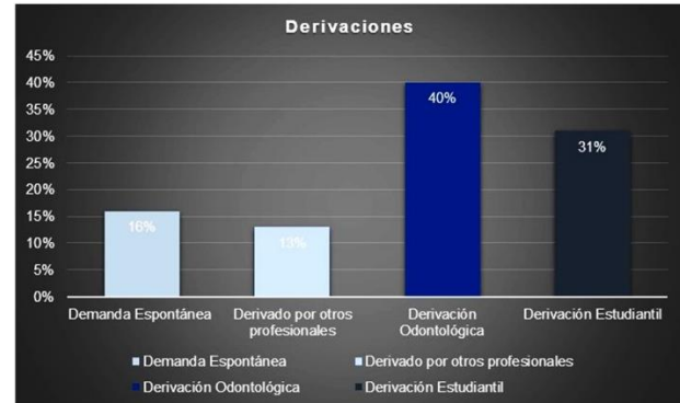
Figura 2. Proporción de pacientes registrados de acuerdo a la vía de derivación.

En el análisis de los datos obtenidos, todas las HC analizadas presentaron las variables a estudiar y en consecuencia, ninguna fue excluida del estudio. Se registraron 67 HC: 61% correspondieron a pacientes de género masculino y 39% de género femenino. La edad promedio fue de 49 años (48 años para los varones y 50 para las mujeres). El Fig. 2 refleja los tipos de derivación registrada. La derivación estomatológica por odontólogos generalistas fue la más frecuente (40% de los casos; 27/67), seguido por la derivación estudiantil (31%; 21/67), la demanda espontánea (16%; 10/67) y la derivación por otros profesionales de la salud (13%; 9/67). Los profesionales de la salud (no odontólogos) más frecuentes en derivar fueron médicos clínicos y cirujanos especialistas en cabeza y cuello.