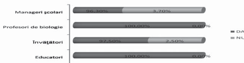
Fig. 1. Rezultatele sondajului de opinie privind predarea în instituțiile superioare de învățământ a disciplinelor cu caracter de educare a stilului sănătos de viață

Conform distribuției procentuale privind pregătirea necesară a cadrelor didactice în vederea efectuării educației pentru sănătate a elevilor 68,1% din educatori au specificat că sunt parțial pregătiți, 25,5% - bine pregătiți, iar 6,4% s-au declarat neinstruiți în acest domeniu. Învățătorii claselor primare consideră că