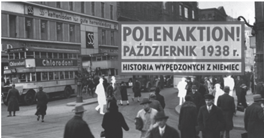
Ryc. 2. Plakat z wystawy poświęconej wypędzeniu Żydów polskich z Niemiec w październiku 1938 r.