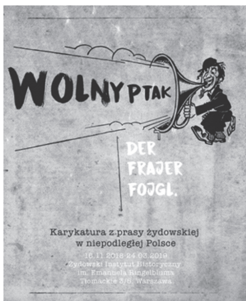
Ryc. 1. Plakat wystawy o karykaturze z prasy żydowskiej w niepodległej Polsce