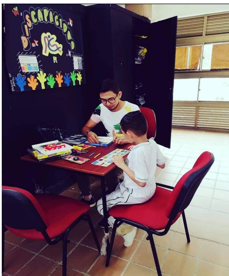
Gamez. W. (2021). Intervención con estudiantes con discapacidad de la I.E. La Esperanza