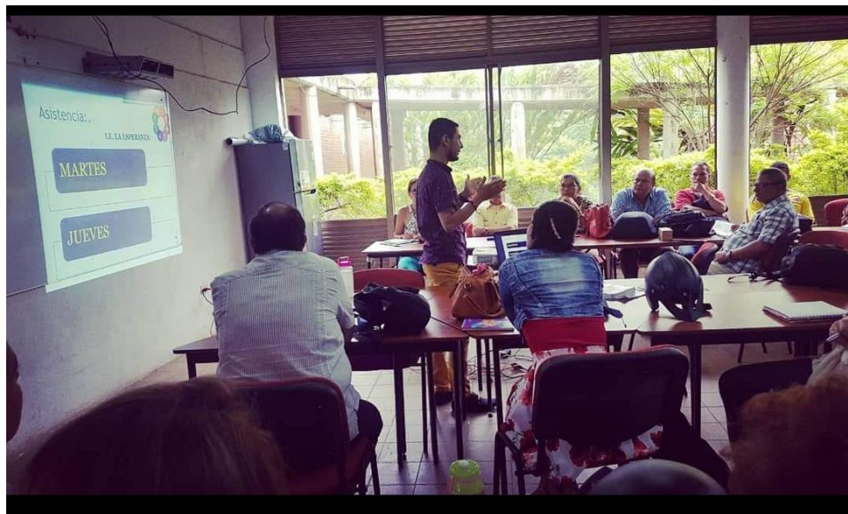
Gamez. W. (2021). Socialización de estrategias interculturales e inclusivas a docentes de la I.E La Esperanza