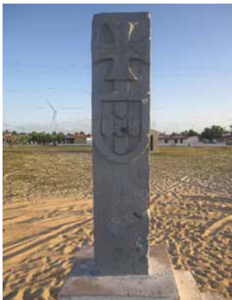
Figura 7. Réplica do Marco Quinhentista