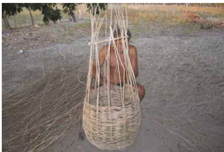
Figura 8. Artesão e pai da participante trabalhando com cestaria

A figura 8 mostra um tipo de trabalho muito aproveitado pelo turismo, o artesanato. Quando indagada acerca das circunstâncias e motivações da fotografia, a autora revelou que o homem trabalhando com os cipós é seu pai, que produz diversos tipos de cestos, muitos dos quais utilizados na própria pesca. A matéria prima é coletada na região, e a técnica de cestaria segue as instruções transmitidas, de forma oral, pela família. A fotografia evidencia também aspectos étnicos, já que Acauã tem na maioria de sua população descendência indígena.