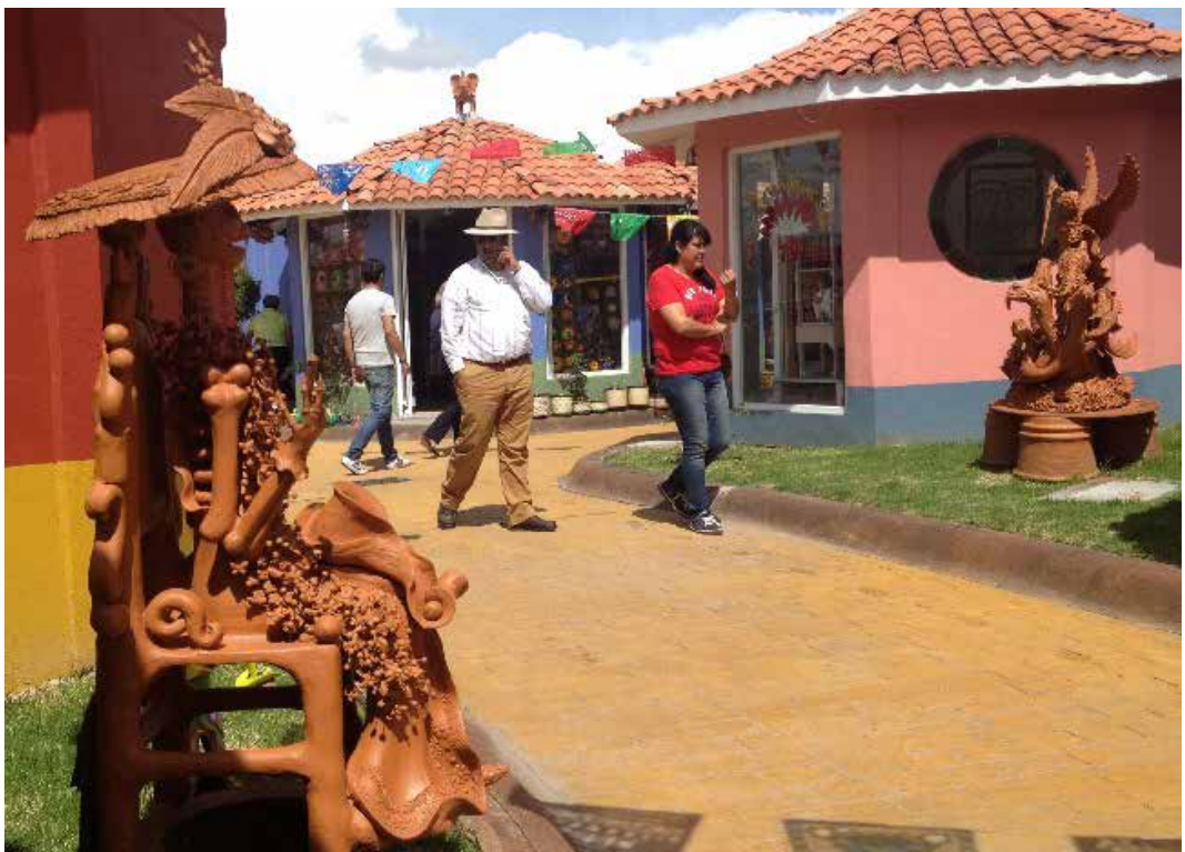
Figura 3: Turistas en el Mercado de Artesanías.

El trabajo en el Mercado Artesanal y la atención a los turistas y demás clientela, no exime a las mujeres de cumplir también con las tareas que socialmente se les suele asignar al interior de las unidades domésticas, como: preparar los alimentos para los miembros de la familia, limpiar, lavar, planchar, entre otras. Las mujeres con hijos pequeños también están al pendiente de la crianza y en muchas ocasiones las niñas y niños salen de la escuela y pasan las tardes en los locales, jugando, haciendo tareas escolares o ayudando a sus mamás o abuelas con pequeñas labores. Es común que las hijas o hijos adolescentes y jóvenes, que siguen estudiando, contribuyan en tareas de elaboración de piezas pequeñas, pintado, decorado o venta en el local.