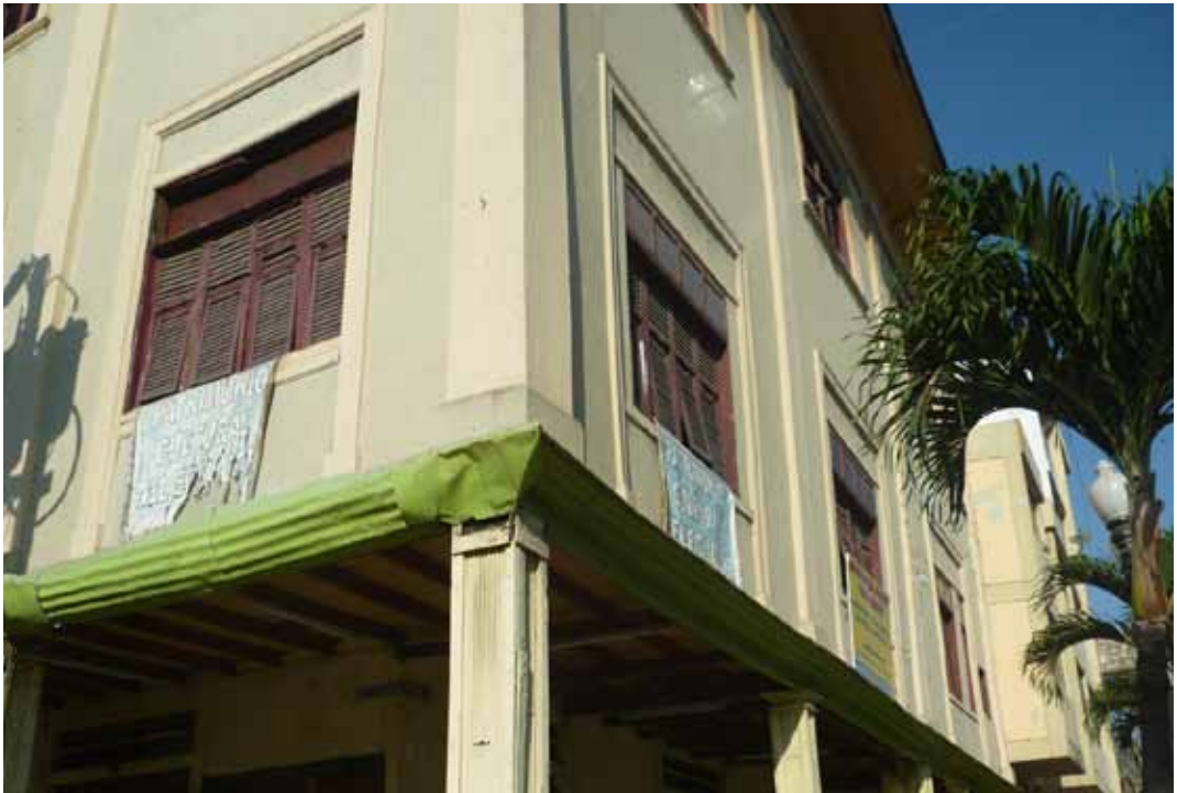
Foto 3: Casa ubicada en las calles Eloy Alfaro y Capitán Nájera, a poca distancia del Malecón Simón Bolívar

Segundo caso: Edificio ubicado en las calles Eloy Alfaro y Capitán Nájera.- Este edificio muestra, como ninguna otra casa de los alrededores de la zona central de la ciudad, las características propias de la arquitectura de Guayaquil: En primer lugar, el soportal que alberga un local comercial; en segundo lugar, la típica construcción mixta (cemento y madera), se puede observar que el piso –que a su vez sirve de techo para el piso inferior- está construido enteramente en madera, mientras que las paredes son una mezcla de caña guadúa y cemento (variante de la quincha, como se mencionó en párrafos anteriores). En ese caso, el soportal queda libre para la circulación peatonal. Aunque no se observa con detalle, en una de las ventanas el dueño de casa ha colocado un letrero que indica que el inmueble es patrimonio cultural de la ciudad. En tercer lugar, las ventanas poseen las llamadas “chazas”: pequeñas rendijas que permiten la circulación de aire al interior de la casa.