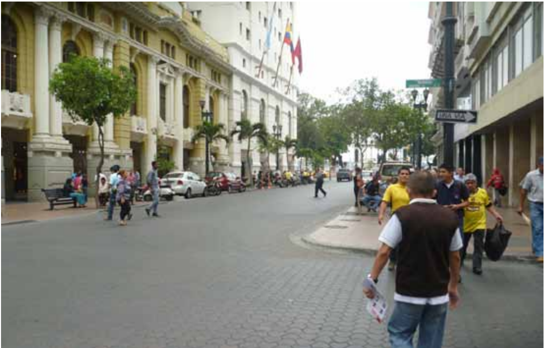
Foto 8: Parte de la Avenida Nueve de Octubre de Guayaquil, con dirección

Como se observa en la foto inferior, la avenida Nueve de Octubre básicamente es un largo callejón cubierto, con las infaltables columnas que sostienen a cada edificio, y con espacio suficiente para que los peatones circulen sin inconvenientes por el sitio.