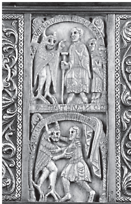
△ Lámina 2.