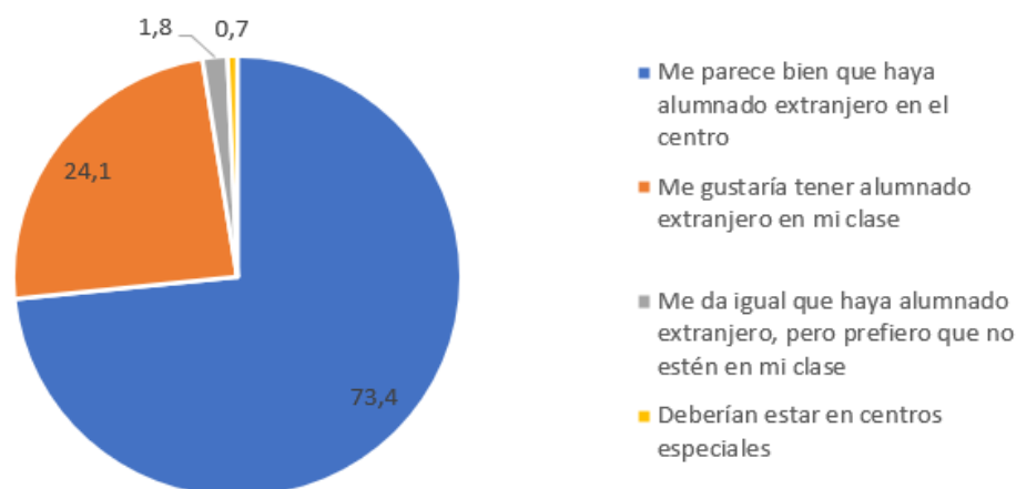
Figura 4. Aceptación del profesorado sobre el alumnado inmigrante. Elaboración propia a partir de la información recogida en el estudio sobre “La escolarización del alumnado de origen inmigrante en España” del Defensor del Pueblo (2003).

En este mismo informe se le realiza también un cuestionario al alumnado nativo de Educación Primaria y Secundaria con la finalidad de descubrir las ideas que tienen sobre la inmigración. Los resultados muestran que el 63,5% tiene una actitud positiva hacia el