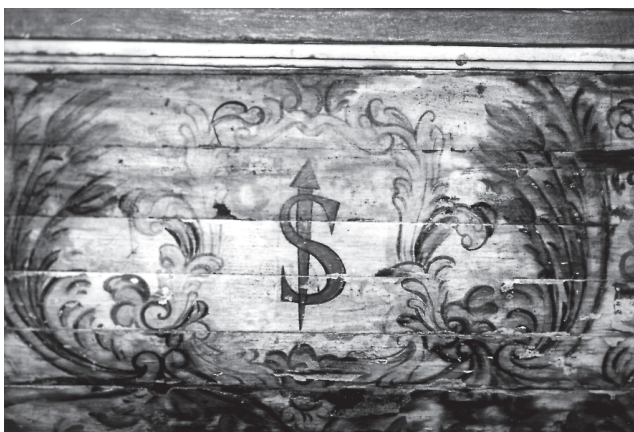
Fig. 4. Retablo de San Antonio el pequeño. Detalle de la mesa de altar. Madera de tea policromada. Siglo xviii.