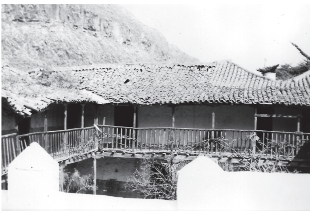
Fig. 2. Hoya de Pineda, Gáldar. Hacienda de los patronos del convento. Primera mitad del siglo XVIII.