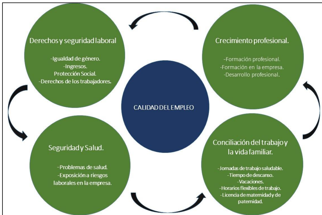
Figura 2. Componentes de la Calidad del Empleo