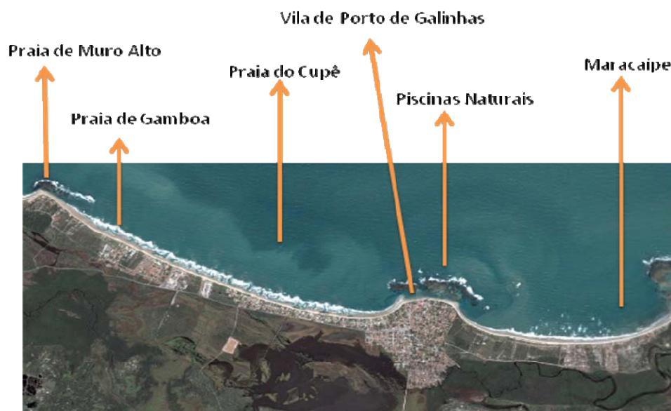
Figura 2: Imagem por satélite de Porto de Galinhas.

[...] o boom em Porto se deu tem 15, 20 anos e foi basicamente com a construção da estrada, antes era um destino de surfistas e depois disso veranistas; o boom se deu porque quatro grandes hoteleiros visualizaram essa vinda pra cá foi e tiveram a visão de induzir, criar o destino turístico. Então quem criou isso aqui como destino foi essa estrutura de hospedagem, foi a iniciativa privada junto com eles vieram bons restaurantes e a comunidade teve essa capacidade de absorver isso então foram criados os serviços que são o passeio de jangada, o de buggy , é um maracatu, uma capoeira que acontece [...]