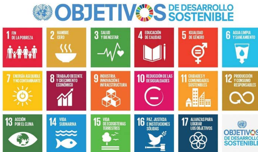
Ilustración 1. (Naciones Unidas, 2015) Captura de pantalla de una artículo de Naciones Unidas

El Grupo de Desarrollo de las Naciones Unidas ha colaborado con PNUD para llevar a cabo esta agenda que se ha llamado MAPS su significado es Transversalización, Aceleración y Apoyo de Políticas. En total son diecisiete objetivos comprometidos con la sociedad, la economía y el medio ambiente, la finalidad es mejorar la calidad de vida y la del planeta. Para que los países puedan llevarlos a cabo se pretende integrarlos en las políticas de la sociedad, también en el conocimiento de las personas y en los valores de las empresas.