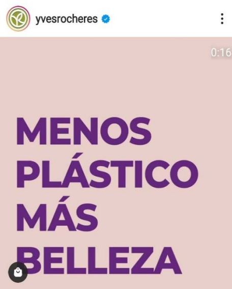
Ilustración 4. (Yves Rocher, 2021) Captura de pantalla de instagram, de un vídeo con el que Yves Rocher publicita su champú sólido.

Hablando sobre su acción por el planeta, como ya se ha planteado, el consumo de productos vegetales favorece la biodiversidad, la lucha contra el cambio climático y la protección de la naturaleza utilizando los beneficios vegetales. También es conocida la “regla de las 3 R” que implica los procesos de Reducir, Reciclar y Reutilizar, con ella, Yves Rocher se compromete a reducir la cantidad de envases que podría ahorrar 30 toneladas de plástico. Por otra parte, en cuanto a la distribución, es una marca que se encuentra presente en 88 países y posee más de 4.000 puntos de venta sumando sus plataformas en internet. (CIDIES, 2012)