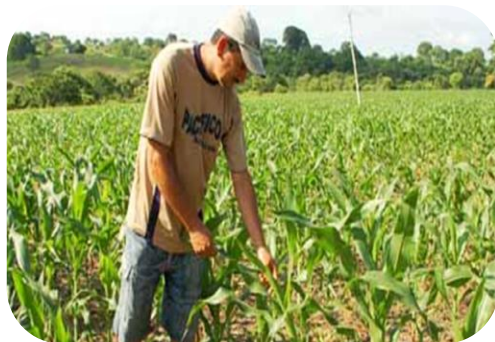
Procedimientos de relación con el regante