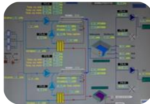
Información de gestión suministrada por automatismos y sensores. IOT