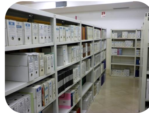
Procedimientos de gestión de documentación