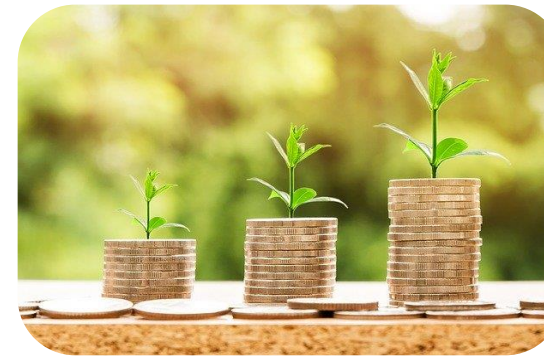
Procedimientos de Facturación, Recaudación y control de costes