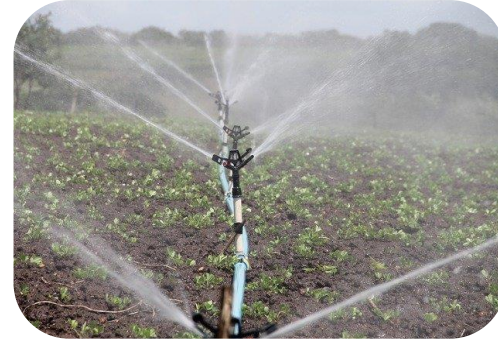
Procedimientos de gestión del agua