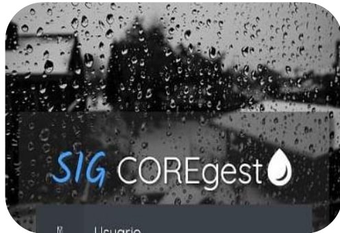
Gestión y Mantenimiento del Parcelario