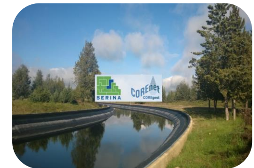
Procedimientos de mantenimiento de infraestructuras y gestión del personal