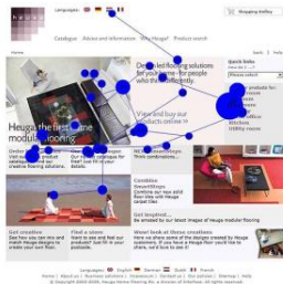
Figura 3. Relatório Representativo da Rota Sacádica.

- Traçado de olhares (“ gaze plot ”): quando se analisa o comportamento visual dos participantes de forma individual é costume usar representações animadas com um ponto na interface, indicando onde este fixou a sua atenção em cada momento, assim como um pequeno traço com a forma de linha, indicando os movimentos sacádicos. É também possível usar representações estáticas do caminho sacádico na exploração visual (embora seja mais difícil de interpretar), mostrando a sequência de movimentos correspondentes às fixações visuais (percurso visual), a respectiva ordem e duração (tempo de fixação).