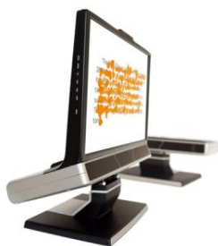
Figura 2. Eye-tracker Remoto

Como foi já referido, o papel do eye tracker é simplesmente o de aferir, na rotação ocular, para onde se dirige a visão central, e consequentemente determinar que zona da cena visual está a ser percebida com maior nitidez em cada momento. O resto da cena visual é processada em paralelo através da visão periférica, que não nos permite identificar claramente os objectos ou elementos presentes – por exemplo, não podemos ler através da visão periférica; mas que permite detectar alterações capazes de guiar ou atrair a nossa atenção.