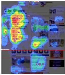
Figura 4. Mapa de Calor

- “Mapas de zonas sombreadas”: para além dos “mapas de calor” existe ainda uma versão complementar designada por “mapas de zonas sombreadas” que permite visualizar em detalhe as áreas com maior concentração de fixações visuais (referenciadas no “Mapa de Calor”) e o potencial da visão periférica nas áreas sombreadas.