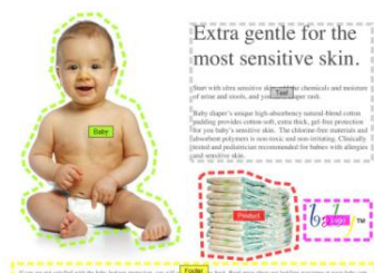
Figura 8. Exemplo de Relatório AOI

Áreas de interesse (também designado de AOI – do inglês “ areas of interest ”): este tipo de representação de dados permite gerar dados estatísticos sobre o comportamento dos participantes em qualquer área do estímulo, relacionando a fixação visual com um conjunto de métricas de eye tracking baseadas nas variáveis tempo e volume.