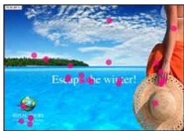
Figura 7. Exemplo do Relatório “Bee Swarm”

Áreas de interesse (também designado de AOI – do inglês “ areas of interest ”): este tipo de representação de dados permite gerar dados estatísticos sobre o comportamento dos participantes em qualquer área do estímulo, relacionando a fixação visual com um conjunto de métricas de eye tracking baseadas nas variáveis tempo e volume.