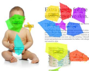
Figura 6. Exemplo de Relatório Cluster

- Cluster : neste tipo de relatório são reveladas as áreas com maior concentração de pontos de fixação durante uma sessão, distribuídas percentualmente pelos participantes que demonstraram interesse nas mesmas.