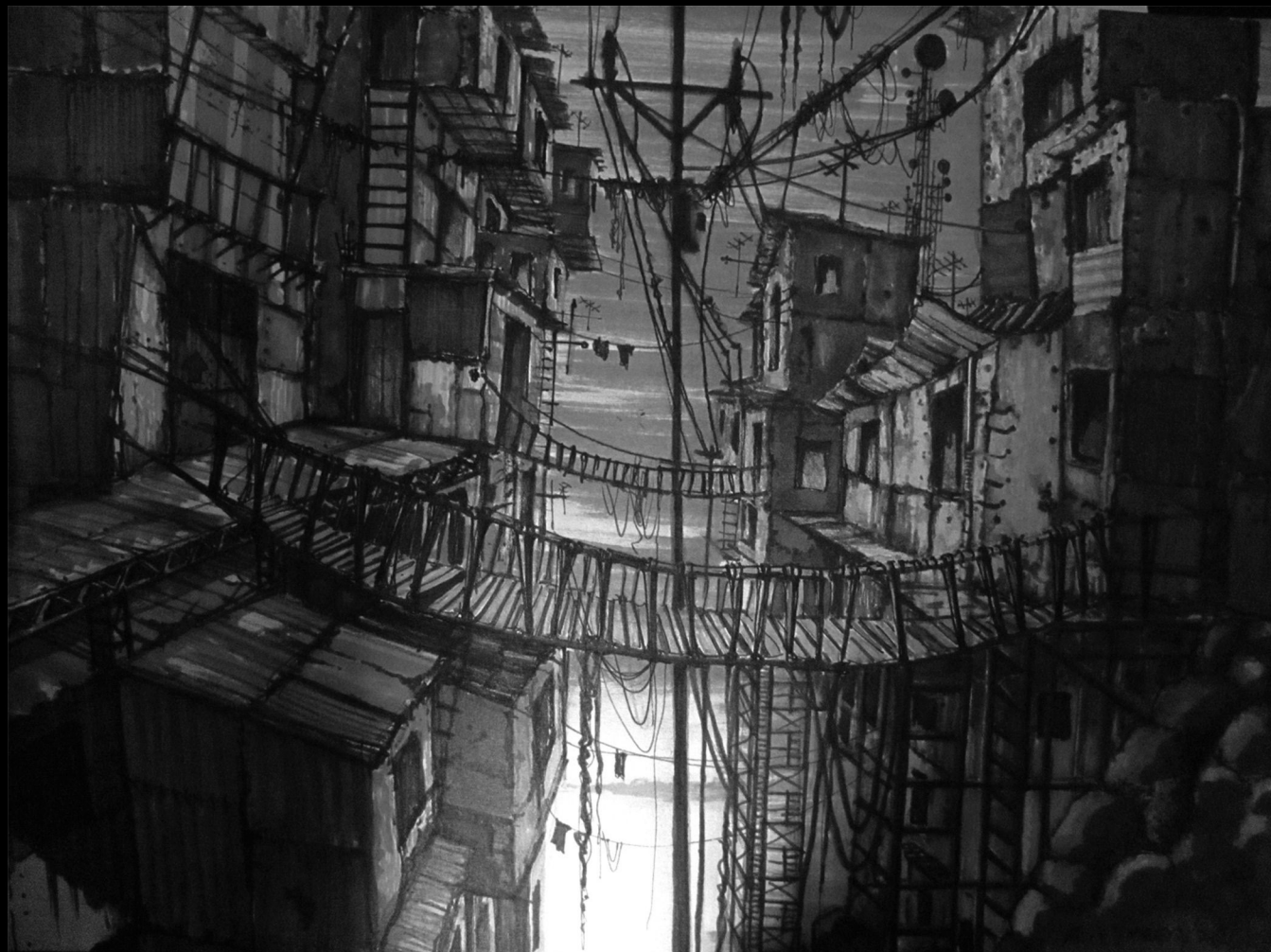
Serie Ciudades Oxidadas / Título: Atmósfera 2 / Técnica Tinta / Autor: Alfonso Espada / 2012