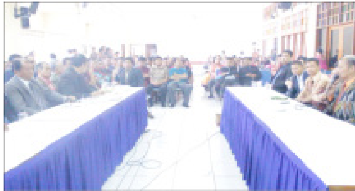
Gambar 2 Posisi duduk peserta komunikasi

dan lebih fleksibel dalam penentuan mediator (raja parhata) serta penuh akan simbol. Simbol tersebut memiliki makna masing-masing yang menunjukkan bahwa suasana pada saat komunikasi dalam kegiatan tersebut sangat sakral, akrab, gembira, namun tegas dan juga saling mendoakan. (2) Prosesi adat marhata sinamot yang ada di Bandung memiliki beberapa perubahan namun tidak menghilangkan makna yang sesungguhnya karena perubahan yang terjadi disebabkan adanya penghematan waktu pada rangkaian acara dan juga perubahan dalam pola komunikasi yang lebih bersifat kesepakatan kelompok. Pola komunikasi tersebut dapat membentuk identitas budaya masyarakat Batak Toba di Bandung.