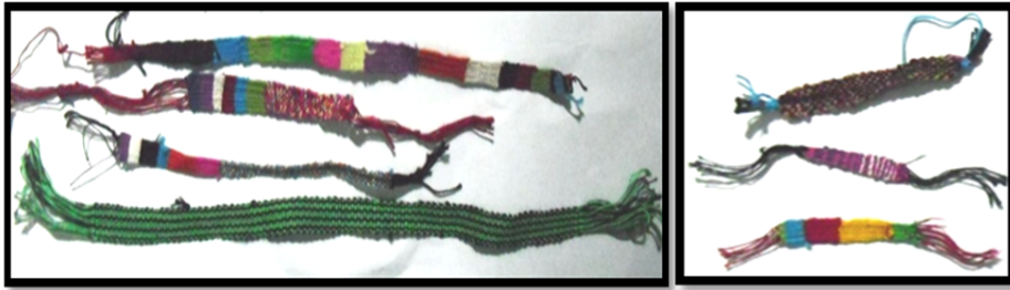
Gambar 6 Hasil tenun anak usia dini.

Proses transmisi pada anak usia dini ini biasa mereka sebut dengan titinunan . Biasanya mereka melakukan kegiatan ini pada saat berkumpul untuk bermain, baik di pagi hari, siang, maupun sore hari. Dari titinunan ini mereka berkembang ke tahap ninun , kemudian ke proses pengolahan benang dan mihane . Hasil tenun anak usia dini diperlihatkan pada Gambar 6.