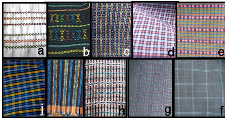
Gambar 3 Motif kain tenun suku Baduy Luar (a) Motif Tajur Pinang , (b) Motif Adu Mancung , (c) Motif Suat Kembang Gedang , (d) Motif Suat Samata , (e) Motif Suat Balingbingan , (f) Motif Sarung Poleng Kacang Herang Carang (Sarung Lelaki), (g) Motif Sarung Kacang Herang Kerep (Sarung Perempuan), (h) Motif Suat Mata Baru , (i) Motif Susuatan/Sanglur/Batik Baru dan (j) Motif Suat Songket .