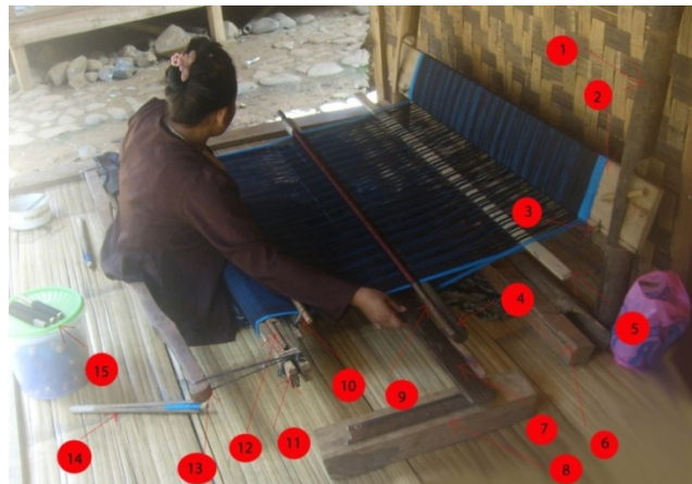
Gambar 1 Alat tenun/pakara tinun yang terdiri dari: (1) Cancangan, (2) Totogan, (3) Pangrambuan, (4) Limbuan, (5) Patitihan, (6) Kekedal, (7) Barera, (8) Rorogan, (9) Jinjingan, (10) Sisir, (11) hapit, (12) pangrearan, (13) cawor, (14) toropong dan (15) pajal.

Alat-alat yang digunakan dalam proses menenun terdiri dari bermacam-macam alat yang membentuk satu kesatuan. Masyarakat Baduy menyebut alat tenun dengan sebutan pakara tinun (Gambar 1). Pakara tinun ini sudah ada sejak zaman dahulu, semenjak nenek moyang mendiami Suku Baduy. Menurut cerita legenda, pakara tinun ini dibuat dari tulang rusuk Nyi Pohaci untuk memenuhi kebutuhan hidup dan memenuhi serta mentaati aturan adat dan amanat dari para leluhur. Setiap kepala keluarga di Suku Baduy bisa membuat pakara tinun , karena hal itu merupakan suatu kewajiban bagi setiap kepala keluarga untuk memenuhi kebutuhan hidup berupa sandang bagi keluarganya.