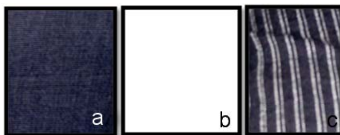
Gambar 4 Motif kain tenun suku Baduy Dalam: (a) Motif Hitam Polos, (b) Motif Putih Polos dan (c) Motif Aros.