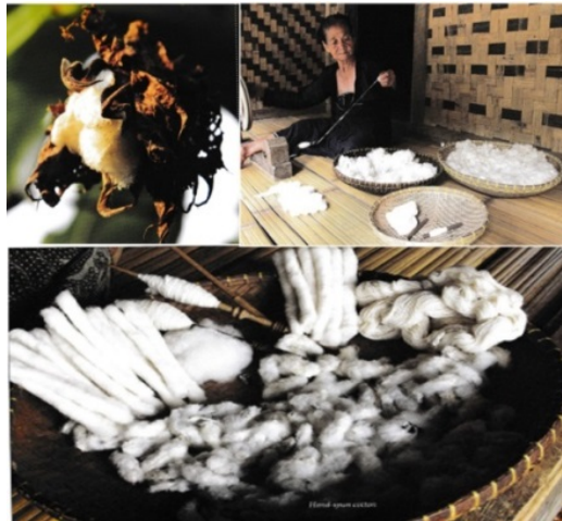
Gambar 2 Pengolahan kapas menjadi benang [5].

Adapun nyikat merupakan proses pembuatan benang yang diberi air tajin (air bubur beras), kemudian diaduk, dibentangkan dan dijemur. Setelah kering disikat dengan alat yang terbuat dari sabut kelapa untuk membuang sisa-sisa air tajin yang mengering dan membuat benang menjadi mudah diatur.