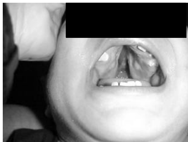
Figura 2: fenda palatina unilateral