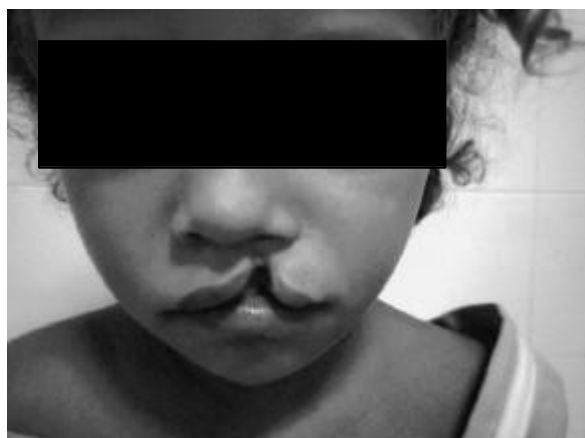
Figura 3: fenda labial unilateral