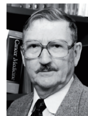
Van Rensselaer Potter

Van Potter estava preocupado com a dimensão que os avanços da ciência, principalmente no âmbito da biotecnologia, estavam adquirindo. Assim, propôs um novo ramo do conhecimento que ajudasse as pessoas a pensar nas possíveis implicações (positivas ou negativas) dos avanços da ciência sobre a vida (humana ou, de maneira mais ampla, de todos os seres vivos). Ele sugeriu que se estabelecesse uma “ponte” entre duas culturas, a científica e a humanística, guiado pela seguinte frase: “Nem tudo que é cientificamente possível é eticamente aceitável”.