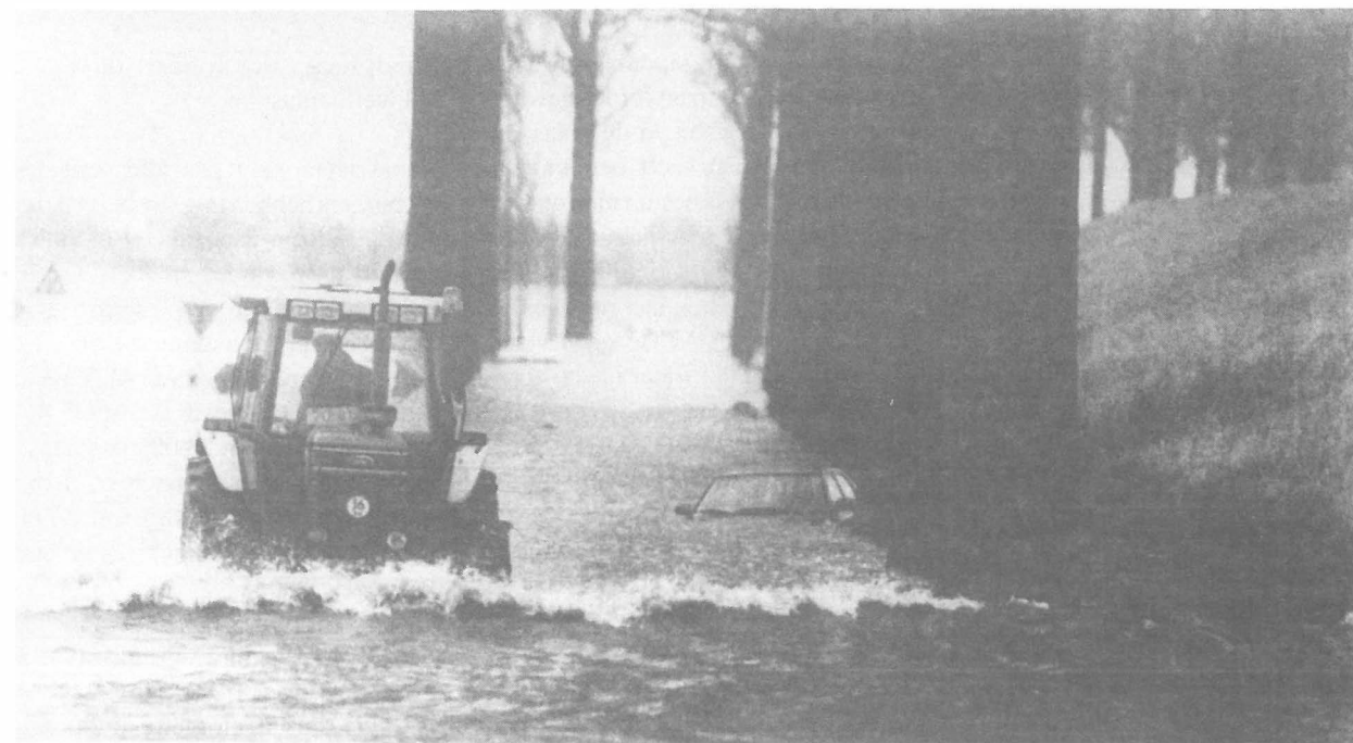
Een tractor laat zien dat hij heel wat meer mans is dan een auto. Je hebt paarden en luxepaarden.

Iets wat in deze situatie echter zeer snel vergeten werd is dat gemeentes soms wel iets ondernomen hebben om de dijken te verbeteren, maar dit leidde dan tot hevige protesten van de omwonende omdat hun prachtige uitzicht op de rivier dan bedorven zou worden. Diezelfde burgers klagen nu steen en been omdat de oude dijk niet sterk genoeg was om hun te beschermen tegen het maaswater.