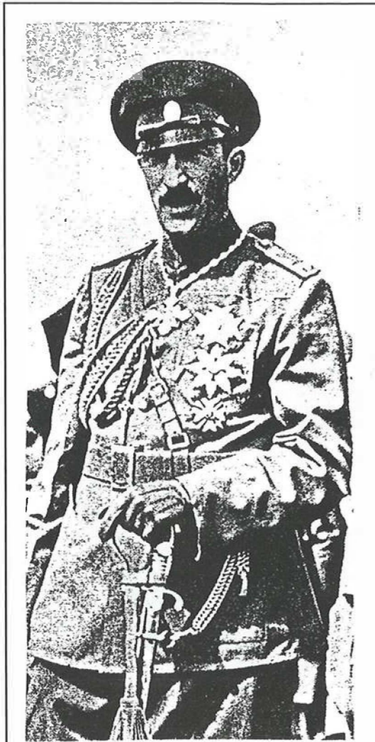
Koning Boris III van Bulgarije

heid bezit waarmee hij de bevolking kan verenigen op hun weg naar de inrichting van een nieuwe democratische staat. De tegenvallende optredens van premiers en presidenten heeft bij veel mensen het vertrouwen in de regering en de hoop op een nieuwe toekomst sterk doen afnemen.