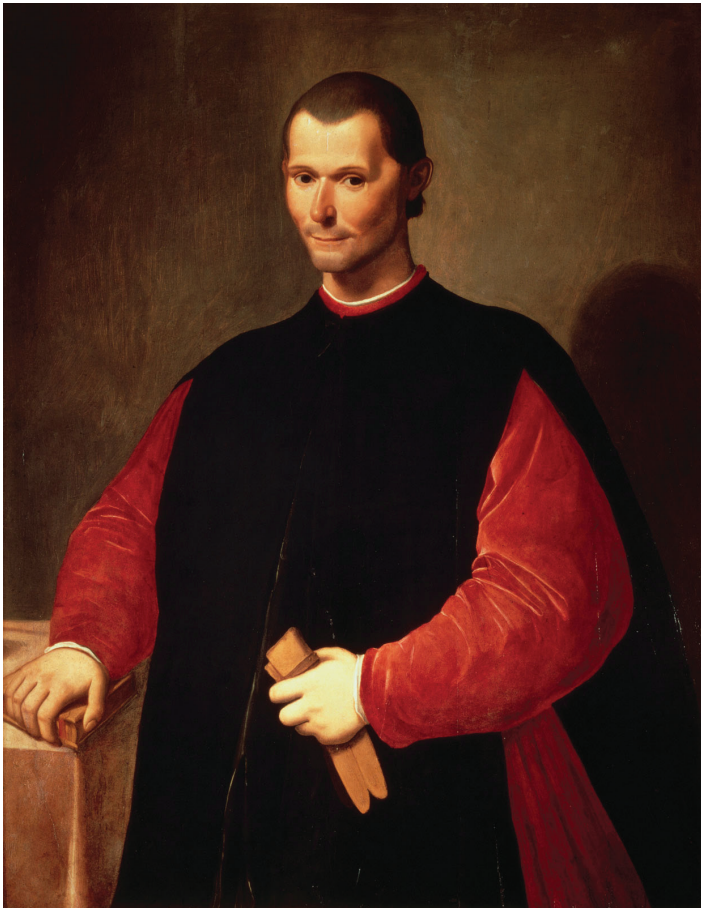
Portret van Niccolò Machiavelli (1469-1527) door Santi di Tito, tweede helft zestiende eeuw.