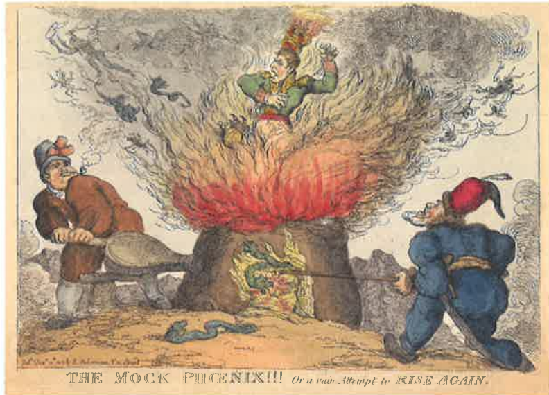
Spotprent op Napoleon na verdreven te zijn uit Nederland in 1813. Napoleon tracht tevergeefs als een feniks uit de vlammen te herrijzen boven een oven opgestookt door de Hollander en de Russische kozak.

die het juk gebroken had: 'Ja, Hy die onze tranen telt / Heeft zelf de reuzenmacht der Tyranny geveld!' 18 Eenzelfde boodschap bevatte ook 'De veldtocht naar Moskau' (1813). Daarin noemde ze Napoleons hoogmoed tegenover God als verklaring voor zijn verlies tijdens de Russische expeditie. 19