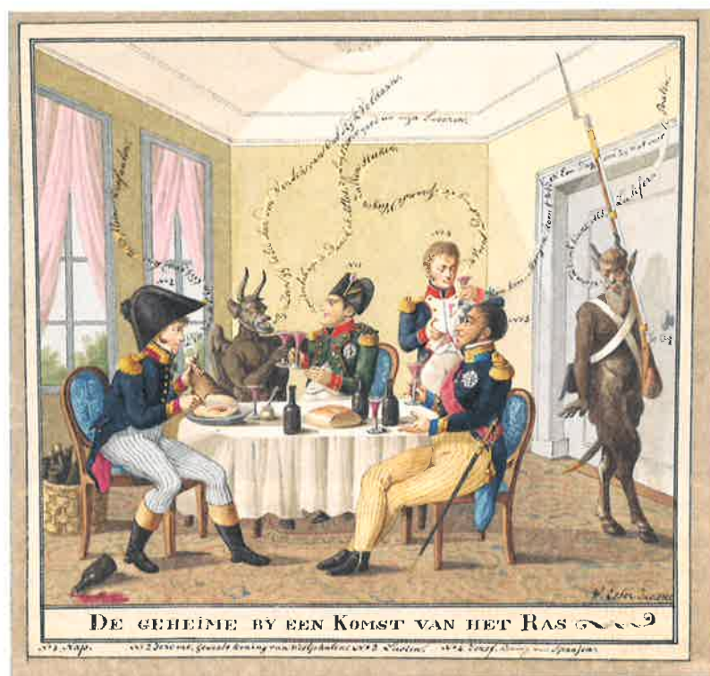
Spotprent op Napoleon en zijn broers, Napoleon heft het glas met de duivel, 1815.

schilde Nederland van bijvoorbeeld Engeland en Duitsland, waar Byron en Goethe al eerder zuiver positieve representaties van Napoleon gaven. In Nederland duurde het langer voordat het litteken van de annexatiejaren 1810-1813 was geheeld. Maar vanaf het moment dat Napoleons gebeente in 1840 naar Parijs werd overgebracht, kantelde het beeld ook hier. Die positieve waardering is sindsdien, ondanks alle schaduwkanten, nooit meer verdwenen.