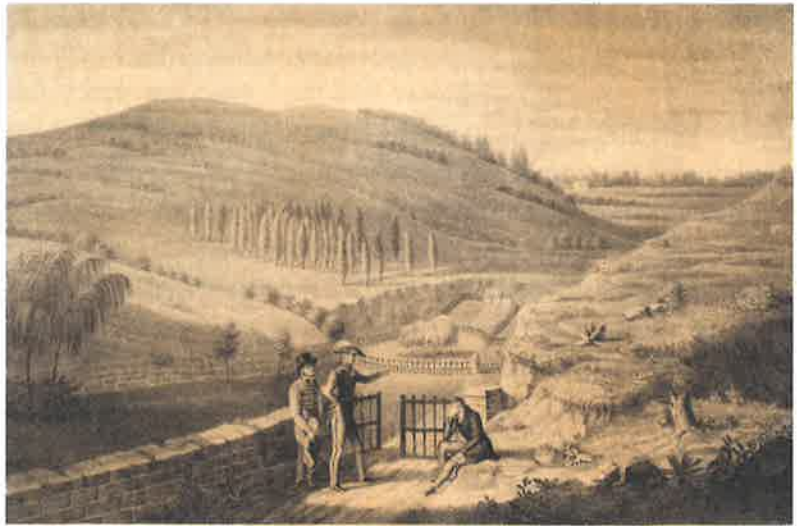
Landschap met het graf van Napoleon op Sint-Helena (ca. 1821-1831). Op de voorgrond enkele bezoekers bij een hek. Een man zit huilend op de grond.

noteerde: 'Longwood ellendig – Schande'. En nadat hij Napoleons slaapkamer gezien had: 'Alles vreesselijke teleurstelling'. Hij was daarom blij toen hij terug aan boord was en verder kon reizen. 42