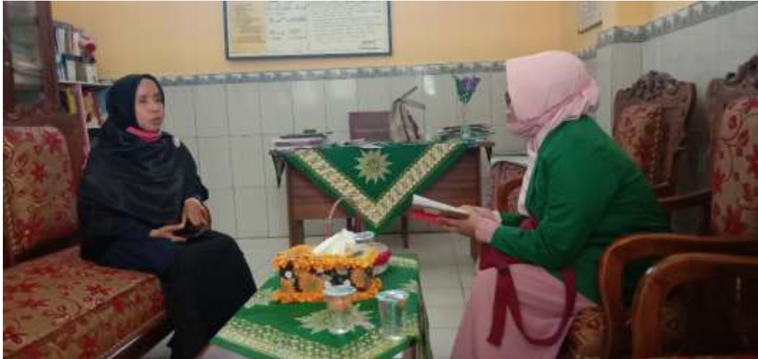
Wawancara Dengan Wali Kelas 1 SD 'Aisyiyah I Mataram