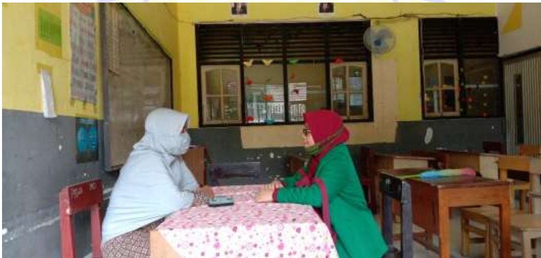
Wawancara Dengan Orang Tua Kelas 1 SD 'Aisyiyah I Mataram