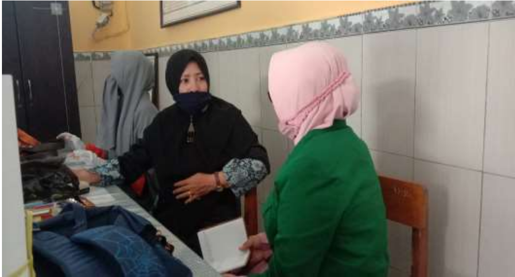
Wawancara Dengan Peserta Didik Kelas 1 SD 'Aisyiyah I Mataram