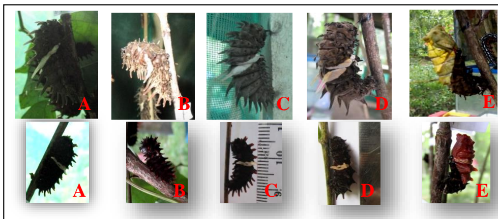
Gambar 1. Aktivitas pupasi T. helena (atas) dan P. aristolochiae (bawah), A). larva memendek, B). membuat benang, C). melengkung dan menggantung, D) warna larva pucat dan kulit melunak, E). kulit larva terlepas.

Pada larva T. helena dan P. aristolochiae , benang dibuat pada bagian posterior dan anterior larva. Ketika membuat benang pada bagian anterior, larva akan membalikkan tubuhnya 180 derajat. Hal ini sesuai dengan hasil penelitian Barua & Slowik (2007) yang menyatakan larva P. aristolochiae diam kemudian secara lambat membalikan ujung posterior tubuhnya dan mengeluarkan benang-benang hitam dan merekatkannya pada batang. Selanjutnya larva membalikan kembali tubuhnya dan membuat benang-benang pada bagian anterior.