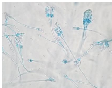
Gambar 3. Hasil pengamatan mikroskopis Penicillium sp.

Berdasarkan hasil pengamatan secara makroskopis, menunjukkan adanya koloni cendawan dengan ciri – ciri sebagai berikut: koloni cendawan yang berwarna abu-abu. Sedangkan berdasarkan pengamatan secara mikroskopis, terlihat ciri- ciri koloni cendawan mempunyai konidia yang berbentuk: koloni bulat atau globose, konidiofor mempunyai cabang, mempunyai hifa bersekat, tidak mempunyai vesikel dan sel kaki, mempunyai fialid tunggal yang dapat dilihat pada (Gambar 3).