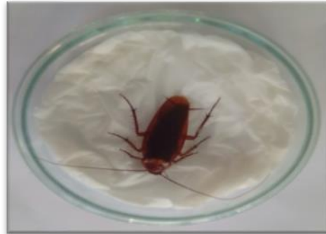
Gambar 1. Isolasi cendawan entomopatogen menggunakan metode Moist Chamber

Cendawan yang tumbuh pada tubuh kecoa dimurnikan menggunakan media PDA. Selanjutnya cendawan yang mempunyai warna yang berbeda di inokulasikan kedalam media PDA menggunakan ose jarum. Lalu diinkubasi pada suhu 25-28°C selama 7 hari diinkubator. Pemurnian dilakukan sampai mendapatkan cendawan yang hanya mempunyai satu warna.