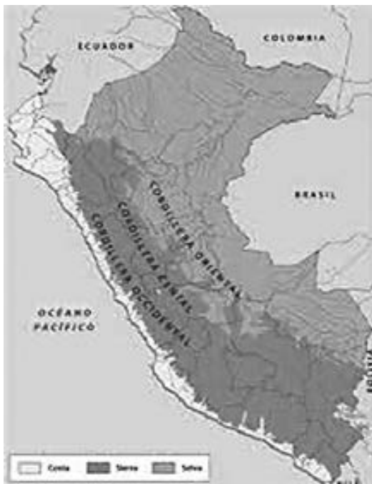
Fig. 1. Mapa fisiográfico del Perú.

El agua es vida. Los valles secos necesitan de este elemento, que proviene del nivel subterráneo. A fin de asegurar su presencia, muchos agricultores han construido en las partes altas de la cuenca fluvial, de forma artesanal, muchas presas pequeñas de tierra y de arcilla, cantos angulosos, y cantos rodados de dos metros de altura, todos los cuales se llenan hasta el tope de agua en la temporada de invierno. Cuando cesa la lluvia, en los meses comprendidos entre mayo