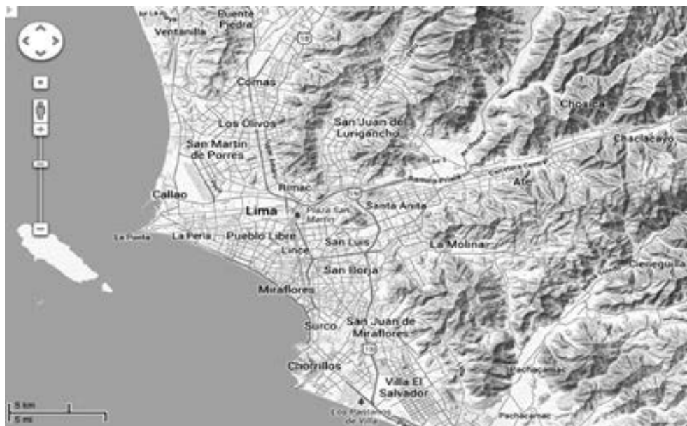
Fig. 2. Cerros alrededor del cono deyección del río Rímac.