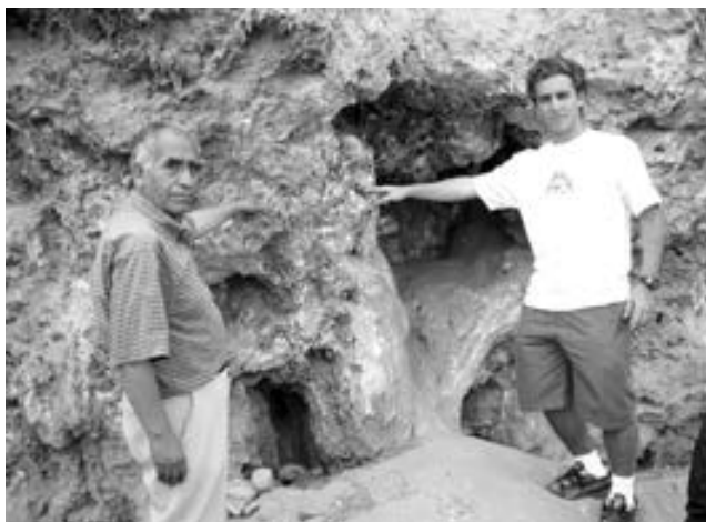
Fig. 3. Travertino en el acantilado de la costa verde formado por deposición de calcita por el afloramiento de las antiguas aguas subterráneas de Lima.

En 1951, en el acantilado frente a la playa Agua Dulce, en Chorrillos, a 10 m sobre el nivel del mar, afloraban cortinas de manantiales de agua dulce que