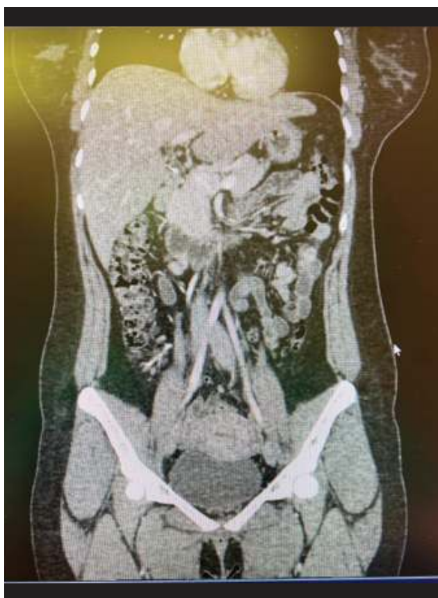
Figura 2. Muestra corte coronal de abdomen y pelvis.

El reporte radiológico describió hígado graso, apéndice normal, intestinos y estómago sin dilatación anormal o engrosamiento de pared. Infiltrados bilaterales en ambas bases pulmonares de apariencia reticulonodular, sugestivo de neumonía bilateral.