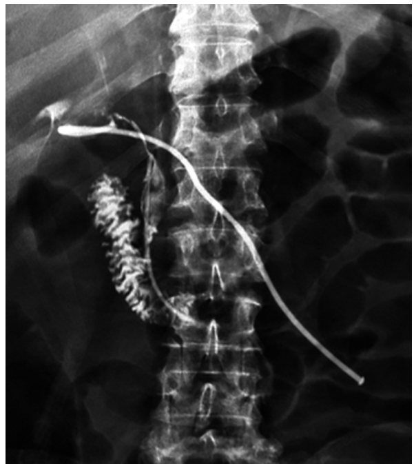
Figura 3. Control trans Kehr con pasaje al duodeno

oportunamente. La presentación clínica incluye la tríada de Quinke: dolor abdominal tipo cólico, ictericia y sangrado gastrointestinal 10, 11 la causa más frecuente de hemobilia es el trauma hepático en el 48% de los casos, seguidos por la infección en 28%, piedras de vesícula, aneurismas y muy raramente por la presencia de un tumor hepático, siendo el pseudoaneurisma de la arteria hepática, aún menos frecuente. 12 Las complicaciones postoperatorias de la cirugía de las vías biliares se clasifican en: inmediatas y mediatas: La hemobilia es considerada inmediatas, debido a que los síntomas se inician en las primeras. 48 h - 72 h del