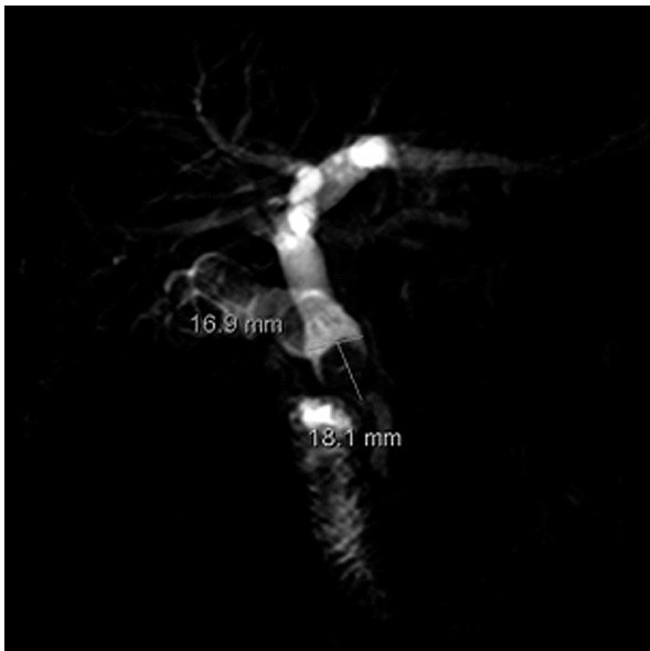
Figura 1. CRM. Cálculos en la vía biliar

Al examen presenta ictericia marcada de piel y escleras y fiebre de 39°C. Abdomen doloroso a la palpación profunda en epigastrio; con tendencia a la hipoxemia. Fosfatasa alcalina en 781U/l, GGT en 464U/l, TGO en 128U/l, TGP 258U/l, BT 13.81mg/dl. Elevada a predominio directa 12.55mg/dl. En la Colangiorenancia magnética, se aprecian vías biliares intrahepáticas dilatadas, colédoco dilatado en 18mm. Seis cálculos en porción proximal, el mayor de 16mm. (Figuras 1 y 2). En la Pancreatocolangio retrógrada endoscópica, se visualiza un colédoco de 22mm. Y varios cálculos el mayor de 20mm. Que no se pueden extraer. Le realizan papilotomía con salida de abundante pus y le colocan una prótesis biliar plástica. Las amilasas se elevan a 2403u/l y las lipasas a 9890 u/l. Es diagnosticado como colangitis aguda por coledocolitiasis gigante + colecistitis aguda calculosa a d/c NM vesícula biliar. Siendo intervenida quirúrgicamente es colecistectomizada, extrayéndole los cálculos de la vía biliar y dejando un dren Kehr, (figura 3).