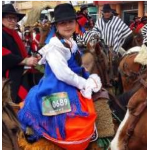
Figura 4. Vestimenta de la Chagra Huarmi.

auténtica. Los atuendos que utilizan la chagra huarmi son similares a las mujeres españolas es decir a las patronas de las haciendas como ellas las llamaban ya que ellas eran las damas de compañía de estas mujeres y por lo tanto quisieron parecerse a ella, pero siempre estos trajes fueron más sencillos (Yáñez, 2017, como se citó en Gualotuña, 2017).