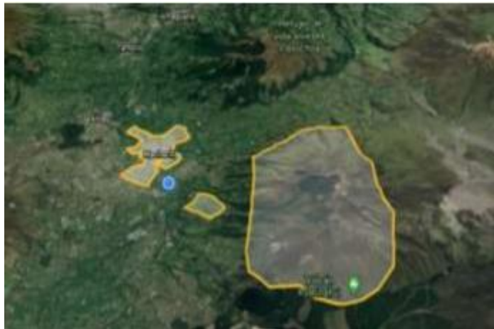
Figura 3. Imagen satelital de las áreas de análisis, el volcán Rumiñahui (1), Panzaleo (2) y Machachi (3)

c. Machachi.- ubicada en el sur de la Provincia de Pichincha, es la cabecera del cantón Mejía; está a una altura de 2.933 metros sobre el nivel del mar. Etimológicamente proviene MA= grande, CHA= tierra/suelo; CHI= vivo/activo, es decir gran terreno activo. Como vocablo quechua significa: valle que, con su belleza de colorido, al embriagarse produce sueño. En Quiché, Machachi significa: Los valientes lanceros y agricultores. Las montañas de Machachi son la cuna de muchas vertientes y el mismo sueño es un perenne afloramiento de aguas termales y minerales, se puede mencionar a las Vegas de San Pedro que se están saturando de aproximadamente 22 fuentes cuyas propiedades químicas y terapéuticas son invalorable (Casnanzuela, 2014).