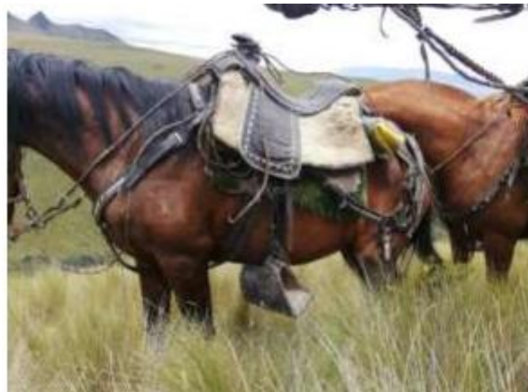
Figura 5. Caballo y los componentes de una cabalgadura.

1) Jáquima o bozalillo 2) Silla 3) Pellón 4) Estriberas de metal o madera forrada de cuero 5) Bridas 6) Gualdrapa 7) Pretal 8) Baticola 9) Arretranca 10) Cincho-barriguera 11) Árguenas 12) Borrén trasero.