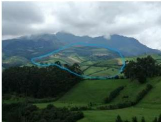
Figura 2. Fraccionamiento de las faldas del volcán Rumiñahui.

vegetación arbustiva es caracterizada por especies vegetales, como romerillo de páramo, puliza, pisag y demás arbustos que le dan vida a este lugar, hace su predominio la flor del andinista (Chuquiragua), el estrato herbáceo está compuesto por diferentes especies de almohadillas y pajonal. En este atractivo turístico se puede observar lobos de páramo, chucuri, conejo, zorrillo, cervicabra, entre otros; anfibios como el sapo, reptiles como la lagartija y una gran variedad de especies de aves, entre las que sobre salen el gavián, torcaza, perdiz de páramo, colibríes, rucos y mirlos. Especies simbólicas como el gavián y el cóndor que ocasionalmente se los puede observar en las rocas y peñascos (Casnanzuela, D. 2014).