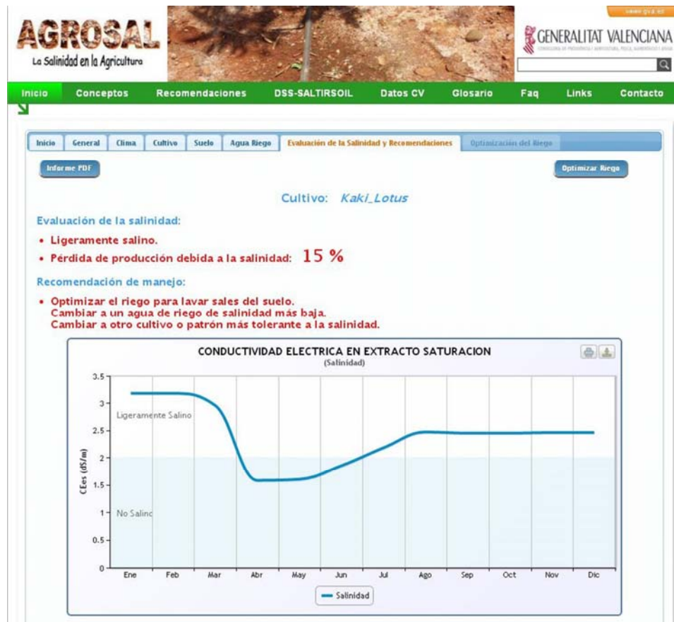
Figura 3. Pestaña «Evaluación de la Salinidad y Recomendaciones».