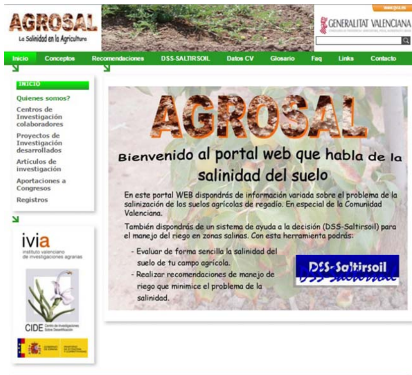
Figura 1. Entrada al portal AGROSAL.

una guía de manejo, un vídeo demostración y el propio sistema, bien pinchando en “Recomendación de Riego” bien en su logo. Así accedemos a una página donde nos identificamos con nuestras credenciales de usuario. En caso de ser nuevos en el sistema, antes de poder utilizarlo nos registraremos.