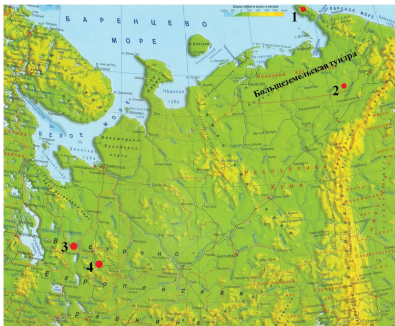
Рис. 1. Карта-схема расположения объектов исследований.

Пробы донных осадков (горизонт от 0 до 10 см) отбирали с помощью ударной прямоточной грунтовой трубки (Aquatic Research Instruments: http://www.