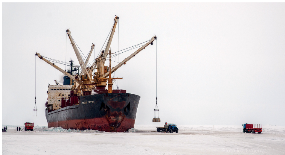
Рис. 1. Разгрузка т/х «Виктор Ткачев» на припай о. Земля Александры в 2015 г.

Если объемы грузов, перевозимых в ходе ледовой навигации, достигают десятков и даже сотен тысяч фрахтовых единиц, необходимо обеспечить одновременную или последовательную разгрузку нескольких судов. Это требует увеличения общей продолжительности грузовой операции. Поскольку вслед за периодом максимальной толщины льда начинается его ослабление и таяние, увеличение продолжительности происходит за счет более раннего начала работ,