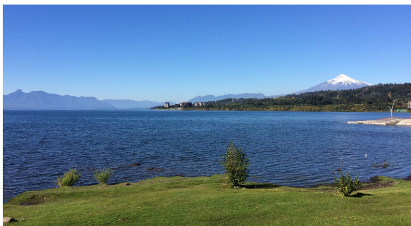
Figura 4. Amenidades paisajísticas y condominios en el borde del lago, Villarrica.

El arriendo, como estrategia de acceso a vivienda para los pobres en Villarrica, enfrenta también otro problema: los arriendos temporales. Es usual encontrar en la ciudad lugares en arriendo, sin embargo, los contratos emanados de aquella relación suelen ser entre Marzo y Noviembre, ya que los dueños de las propiedades las solicitan libres para los meses de diciembre, enero y febrero para ser arrendadas a turistas que arriban hasta la zona durante el verano. Durante los meses estivales, el albergamiento se vuelve parte de la cotidianidad de muchos sin casa que habitan en la ciudad.