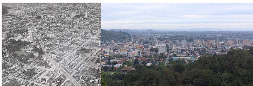
Figura 1. Condominios en altura en el área central de Temuco, 1980-2018.

Fuente: archivo "Paisajes culturales de la capital de La Frontera" y archivo personal.