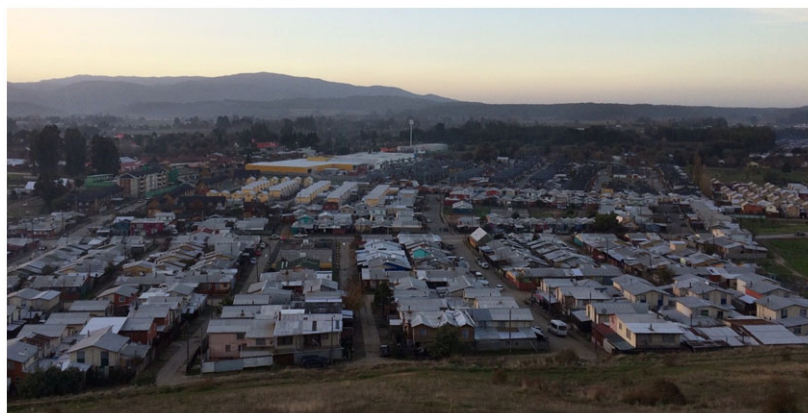
Figura 3. Viviendas sociales combinadas con desarrollos inmobiliarios de clase media, Angol.

Tampoco se observa el inicio de un proceso de fragmentación espacial en Angol entre 2006 y 2015. La vivienda social, aunque disminuye considerablemente su producción durante este periodo a tan sólo 113 residencias promedio por año, continúa conectada e integrada espacialmente a la ciudad. Sin embargo, los datos recogidos desde la Dirección de Obra Municipal muestran dos cambios en la construcción de las viviendas sociales durante este periodo. El primero es que el tamaño de los proyectos de vivienda tiende a reducirse. Y segundo, que la construcción de este tipo de barrios comienza a realizarse más cercano a zonas bien servidas de la ciudad. Ambos aspectos parecen consecuencia directa de la reorientación que las política de vivienda han estado experimentado en los últimos años y que buscan localizar a grupos de menores ingresos en sectores heterogéneos socialmente, en un esfuerzo por la integración social.