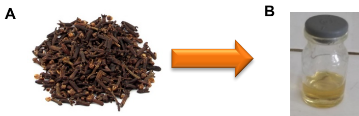
Figura 1- Botões florais de S. aromaticum (A), OECRAVO (B)

O OE dos botões florais de Syzygium aromaticum foi obtido por hidrodestilação em aparelho do tipo Clevenger durante 2h. Em seguida, o óleo essencial foi coletado, armazenado em frascos de vidro (Fig. 1) e estocados em freezer.