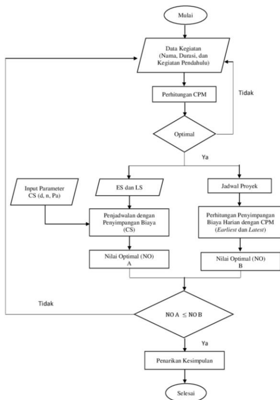
Gambar 1. Diagram Alir Penelitian

Perhitungan data dengan metode CPM, diolah dengan bantuan software POM QM for windows. Sedangkan perhitungan data dengan algoritma CS diolah dengan bantuan software Scilab.