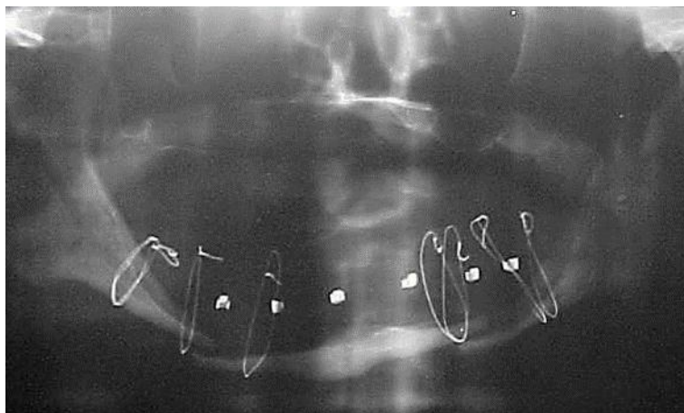
Fig. 4: Rx de control