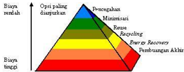
Gambar 1. Hirarki Pengolahan Sampah (KLH, 2014)

Adapun dasar hukum mengenai pengolahan sampah di Indonesia khususnya di Kabupaten Garut antara lain: